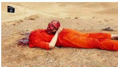
Figura 3 – Degola realizada pelo ISIS em 2014.