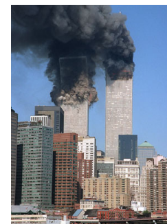
Figura 6 – Ataque da Al-Qaeda em 2001.

Segundo Lind et al. (1989), a Quarta Geração se refere ao uso intensivo da propaganda, doutrinação, terror e segredo. Os insurgentes buscam vencer a superioridade militar do opositor abalando sua reputação, desafiando-o e humilhando-o. Muitos desses insurgentes atuam globalmente. Sua vitória moral é obtida provocando divisões internas na opinião pública inimiga, ameaçando-a constantemente e disseminando a incerteza e a desconfiança sobre seu futuro econômico. Ou seja, o alvo dos grupos rebeldes é toda a sociedade inimiga, e não somente suas forças armadas. Não há nestes casos uma distinção clara entre o front interno e o campo de batalha. Desaparece igualmente a distinção entre civis e militares. São operações psicológicas e a luta torna-se uma guerra de nervos. Informação em vez de mísseis é a arma principal destes grupos que visam atormentar em vez de destruir o inimigo. Para tanto, lhes parece mais relevante ocupar alguns minutos dos telejornais do que matar soldados. Este tipo de ação equivale ao conceito anarquista de “ação direta” e de “propaganda pelos