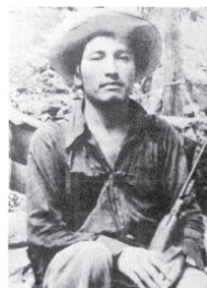
Figura 9 – Lucio Cabañas