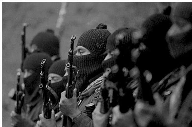
Figura 1 – EZLN enfrenta as forças do Governo.

(Ver ANEXO versão em inglês deste texto disponível em: < http://revistaseletronicas.pucrs.br/ojs/index.php/famecos/... >.)