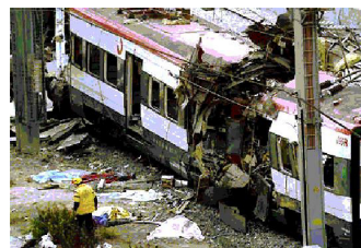
Figura 5 – Bomba destruiu um trem em Madri em 2004.