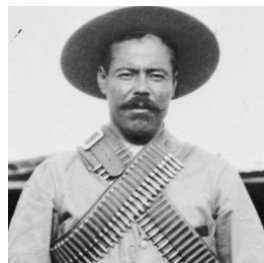
Figura 8 – Pancho Vila