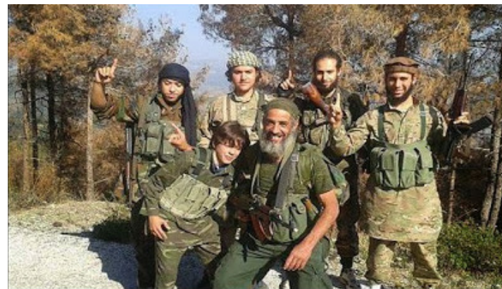
Figura 2 – Família marroquina luta na Síria junto à Al Qaeda.