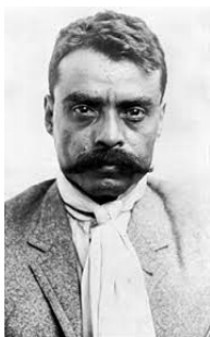
Figura 7 – Emilio Zapata

O público de simpatizantes que cultiva um mal-estar crônico ao consumismo acolhe com simpatia a retórica zapatista que mescla as tradições indígenas com os clássicos da literatura ocidental numa prosa irônica, paradoxal, bem humorada e desafiadora. O subcomandante Marcos costumava explicar aos ‘peregrinos’ que os comunicados do movimento almejam “explicar através do coração as ideias que eram destinadas à cabeça”. A verdade é que há certa inocência (que fascina o observador) nos jogos de linguagem destes manifestos. Os visitantes também observam com interesse e esperança a democracia participativa aplicada nas comunidades indígenas. Ela envolve consultas, assembleias comunitárias e os Conselhos da Boa Governança que aplicam as decisões.