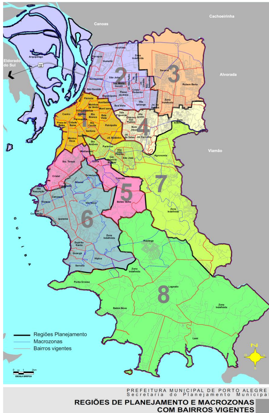
Figura 1 – Macrozonas do Município de Porto Alegre