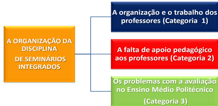
Figura 2 – Categorias Emergentes em relação ao segundo objetivo específico

A seguir são apresentados metatextos em relação a essas categorias. Segue um esquema das categorias emergentes: