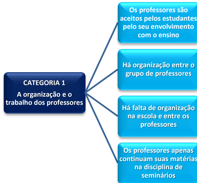
Figura 3 - Categoria 1 e suas Subcategorias

Em dois grupos, 5 e 7 7 , houve relatos que seus professores de Seminários são aceitos pelos estudantes pelo seu envolvimento com o ensino . Nestas escolas existe uma organização maior e um entendimento entre alunos e professores. Por exemplo, conforme afirma a aluna 5S14,