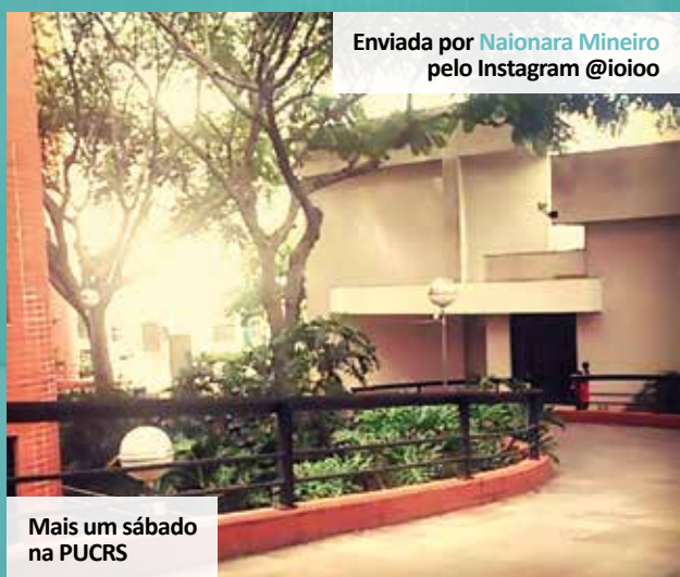
Enviada por Naionara Mineiro pelo Instagram @ioioo