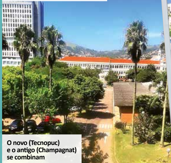
O novo (Tecnopuc) e o antigo (Champagnat) se combinam