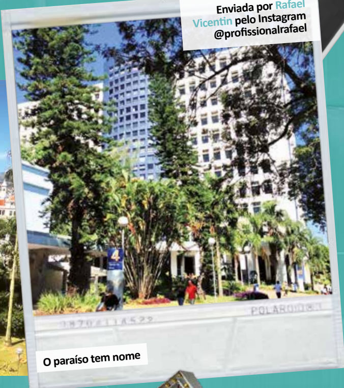
O paraíso tem nome