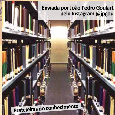
Prateleiras do conhecimento