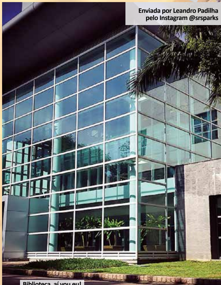
Biblioteca, aí vou eu!

Enviada por João Pedro Goulart pelo Instagram @jpgou