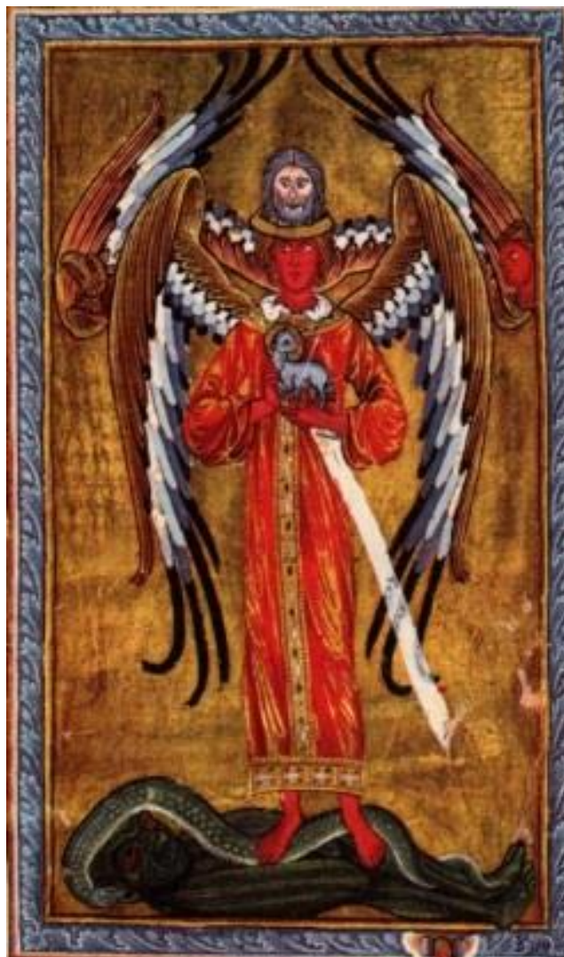
Imagem 1 – Primeira Visão, “Sobre a Origem da Vida” ( Liber Divinorum Operum )

Após descrever detalhadamente a aparição, Hildegarda descreve a mensagem transmitida por esta figura, que diz a visionária: