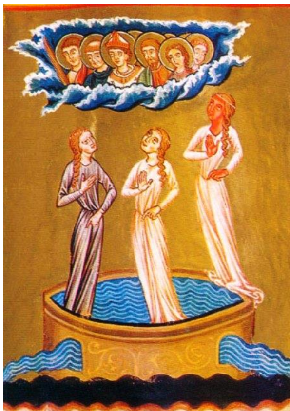
Imagem 2 – Oitava Visão: Sobre o Efeito do Amor ( Liber Divinorum Operum )

enraizadas na fonte, por assim dizer, assim como as árvores, por vezes, parecem crescer na água.” 90 Uma forma estava envolta em um reflexo roxo, e a segunda por um brilho deslumbrantemente branco. Já a terceira figura não estava dentro da fonte como as outras duas, mas estava próxima, sobre a pedra que cercava a fonte, e vestia uma roupa branca, tal como a segunda, igualmente ofuscante. Segundo Hildegarda o rosto desta terceira figura irradia tanto brilho que a monja teve que desviar o olhar dela. Por fim, acima destas três figuras, apareceram em meio a nuvens fileiras com numerosos santos, que olhavam atentamente para as figuras. Na imagem abaixo temos uma parte da iluminura que retrata esta visão da religiosa: