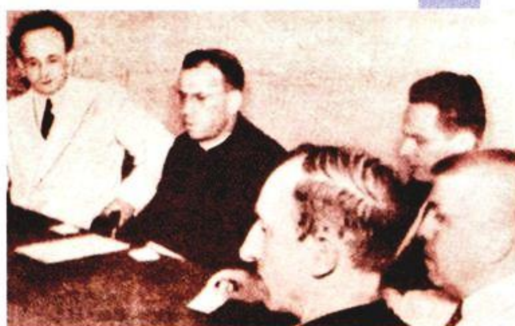
Primeira turma de Filosofia, Ciências e Letras (esq.) e ato inaugural da Universidade Católica