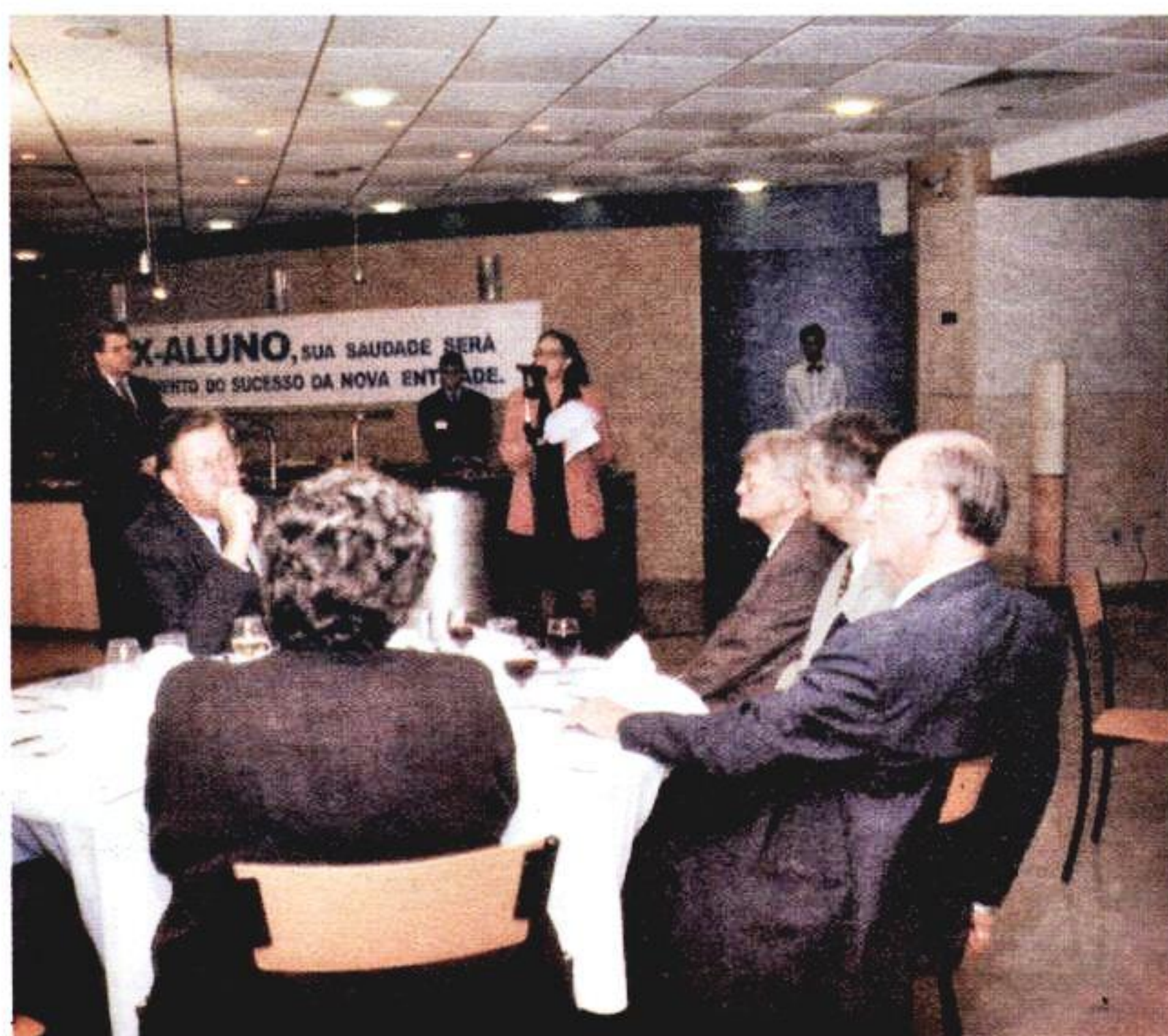
Jantar reuniu 140 ex-alunos da PUCRS

A idéia de criar uma entidade representativa dos ex-alunos da PUCRS foi lançada oficialmente durante um jantar realizado no mês de maio, no Restaurante Panorama. Na ocasião, com a presença de 140 ex-alunos da Universidade, foi criada uma comissão composta de 20 membros, escolhidos pelos presentes durante o evento. Desde então, esta equipe cumpre etapas visando dar uma forma final à associação.