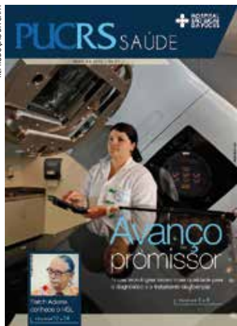
REPRODUÇÃO DA CAPA

AS NOTÍCIAS do Hospital São Lucas são abordadas na nova revista PUCRS Saúde , que recomeçou a circular em abril em 32 páginas, com novos projetos gráfico e editorial. Os investimentos em inovação tecnológica, que trazem melhorias à assistência, são o tema de capa. Além da versão impressa, a publicação está disponível no site www.hospitalsaolucas.pucrs.br . A revista PUCRS Saúde é produzida pelo núcleo de Imprensa do Hospital, com periodicidade semestral.