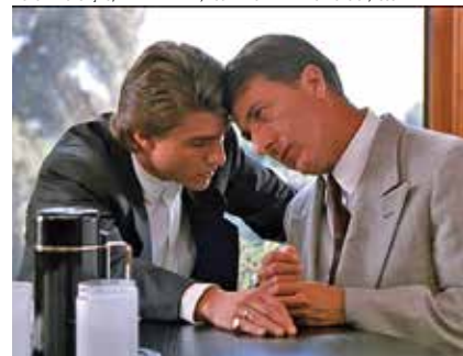
RAIN MAN, DUSTIN HOFFMAN E TOM CRUISE, 1988

rompem suas próprias barreiras. A conscientização é o primeiro passo neste importante processo de inclusão social.