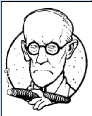
Ilustração: Rick Geary

Em 6/5 se celebra os 150 anos do nascimento de Sigmund Freud, o Pai da Psicanálise. Para lembrar a data, a Faculdade de Psicologia realiza o Seminário 150 Anos do Nascimento de