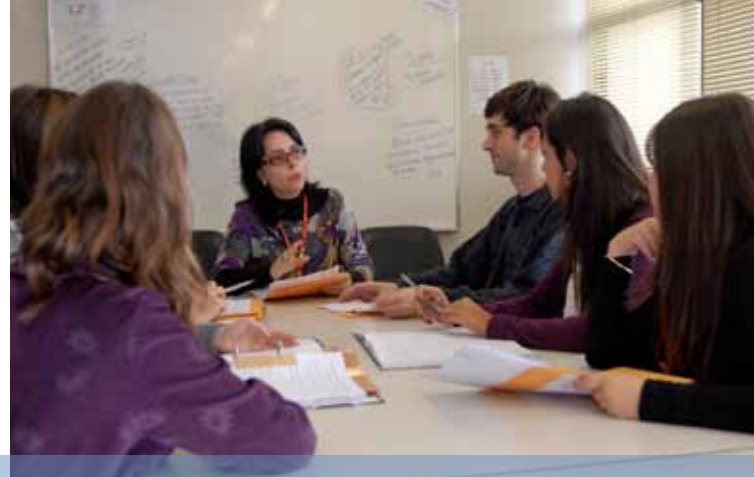
Em reunião, professora e estudantes de psicologia conversam sobre atendimentos no SAPP