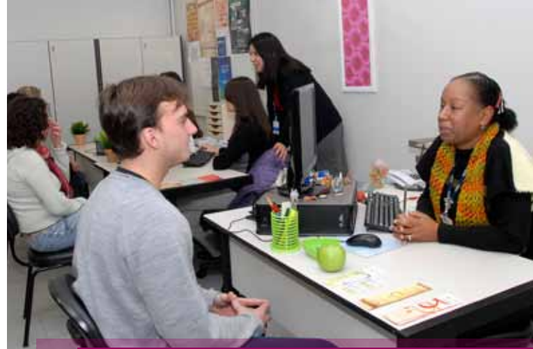
Estrutura específica facilita o atendimento ao aluno de iniciação científica

No mês de junho, foi inaugurado o Espaço Iniciação Científica da PUCRS. Dedicado especialmente ao estudante de graduação que deseja iniciar-se ou aprofundar-se no universo da investigação acadêmica, o local é a uma iniciativa da Pró-Reitoria de Pesquisa e Pós-Graduação (PRPPG). Localizado no prédio 15, une-se ao ambiente da Central de Atendimento ao Aluno. Uma sala específica foi destinada a informar sobre possibilidades de atuação em projetos, de indicação a bolsas e de participação em eventos de Iniciação Científica, da PUCRS e de outras universidades.