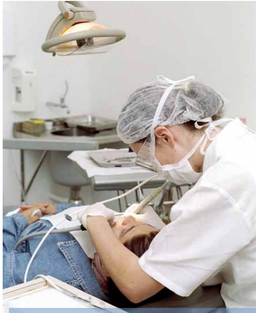
Assistência odontológica registrou mais de 1.000 atendimentos na sede do Centro

Unidades acadêmicas que mantêm atividades curriculares no Centro de Extensão: Faculdades de Arquitetura e Urbanismo, de Direito, de Educação, de Enfermagem, Fisioterapia e Nutrição, de Farmácia, de Letras, de Medicina, de Odontologia, de Psicologia e de Serviço Social, além do Hospital São Lucas.