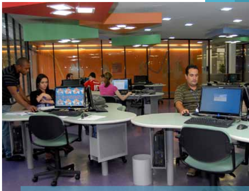
Laboratório de Aprendizagem, um dos espaços do Logos, une tecnologia, cores e arquitetura moderna

Ao completar 61 anos de fundação, a PUCRS inaugurou o Logos: Aprendizagem sem Fronteiras. O local foi criado para que estudantes possam aprofundar os conteúdos em que necessitam de apoio, contando com o suporte de docentes e monitores. O espaço, vinculado à Pró-Reitoria de Graduação (PROGRAD), conta com uma arena para oficinas, cursos e reuniões, com 40 lugares; o Laboratório de Aprendizagem (LAPREN); e o Laboratório de Ensino Atendimento a Pessoas com Necessidades Educacionais Específicas (LEPNEE), coordenado pela Faculdade de Educação. Os espaços têm acessibilidade universal, com rampas e pisos com sinalizadores. A PROGRAD também mantém no local as Coordenadorias de Ensino e Desenvolvimento Acadêmico, de Avaliação, de Tecnologias Educacionais, de Apoio à Formação Acadêmica e de Integração Ensino-Serviço na Saúde.