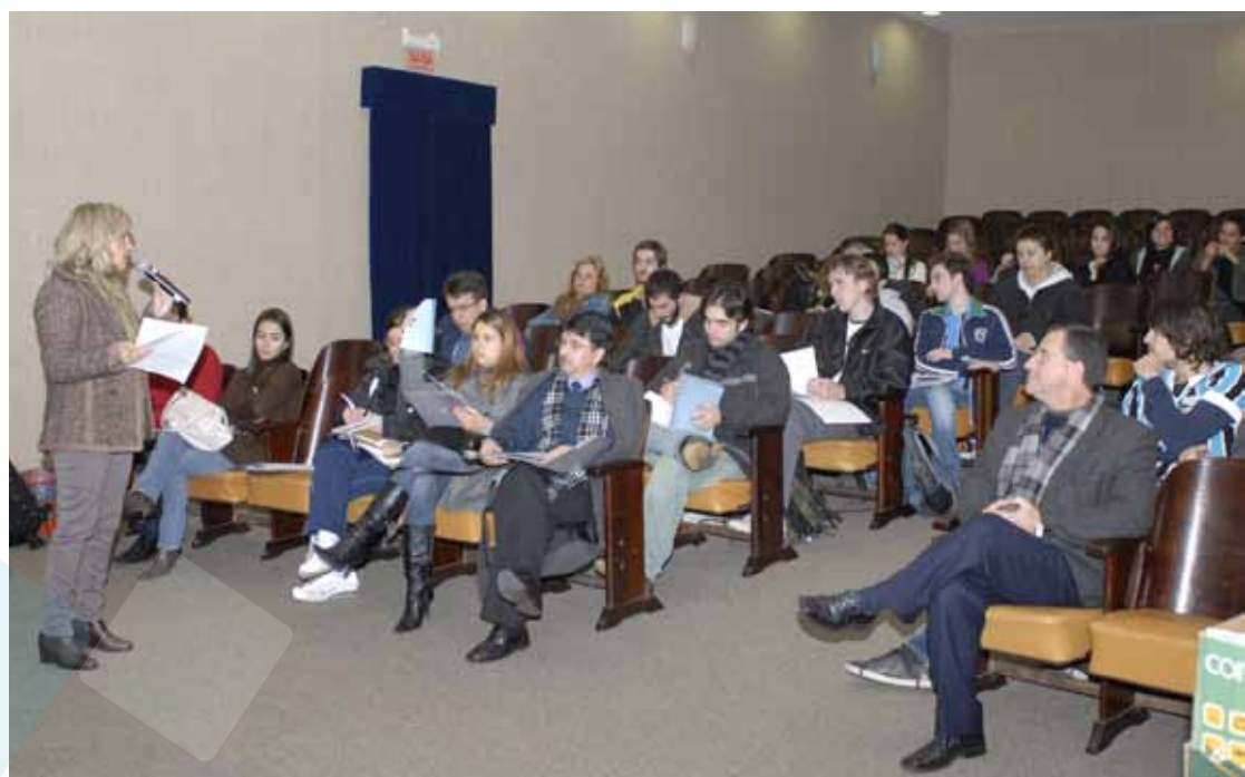
Antes de embarcar para o exterior, alunos da PUCRS recebem todas as orientações do PMA