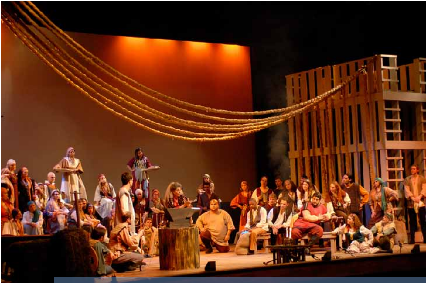
Ópera do italiano Giuseppe Verdi reuniu solistas brasileiros e estrangeiros

Todas as quartas-feiras, das 13h às 13h30min, a comunidade acadêmica desfruta de um momento cultural, com entrada franca, no átrio da Faculdade de Arquitetura e Urbanismo, no Campus Central da PUCRS. O Projeto Sobremesa Musical, a cada semana, apresenta um dos grupos da Orquestra Filarmônica da PUCRS (cordas, metais, trombones e percussão, entre outros), com um variado repertório contemporâneo.