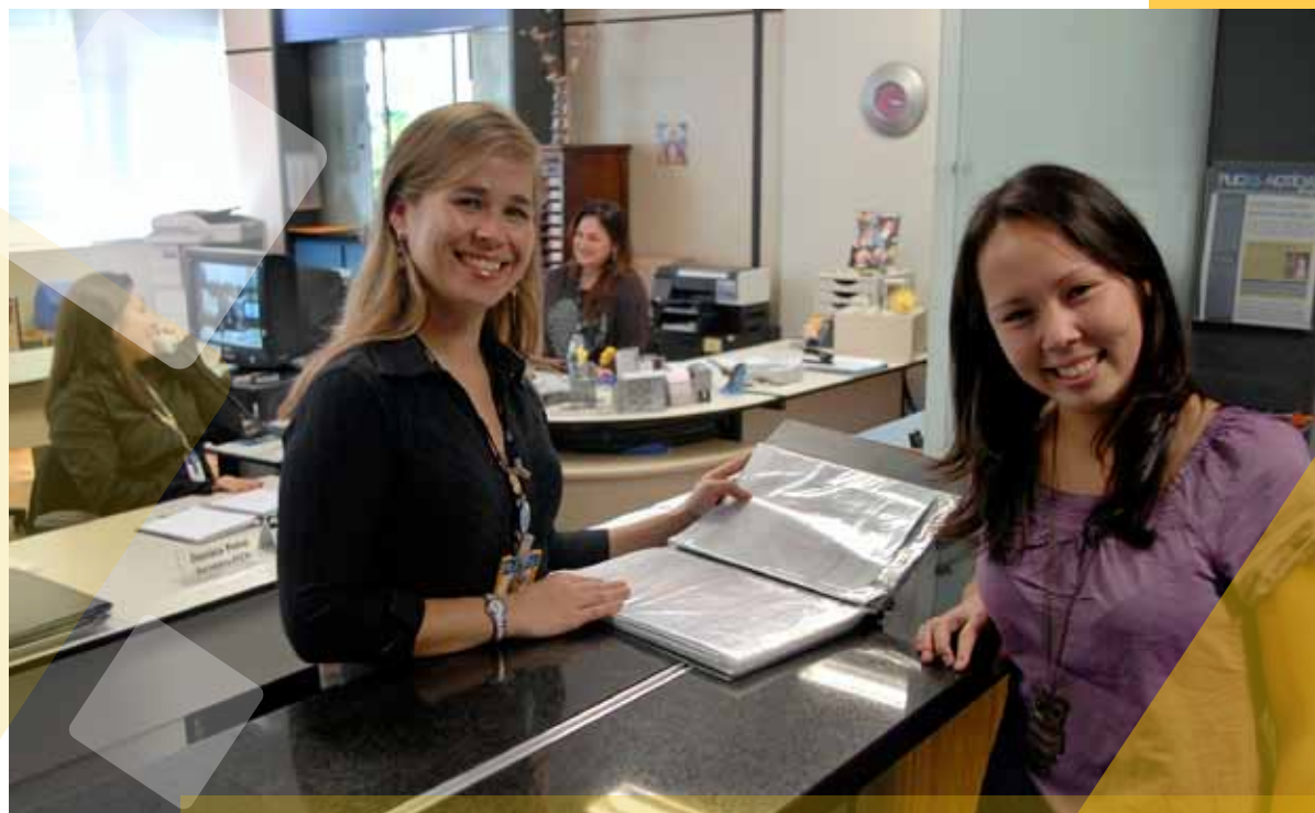
Atendimento na secretaria da Faculdade de Filosofia e Ciências Humanas