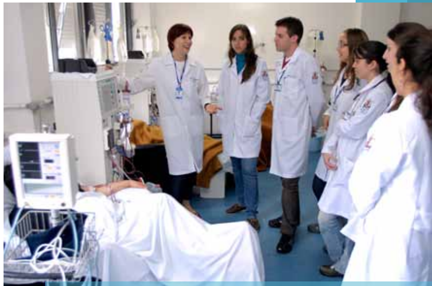
Alunos do Premus recebem instruções no Setor de Nefrologia do Hospital São Lucas

A primeira turma do Programa de Residência Multiprofissional em Saúde da Família e Comunidade da PUCRS (Premus) se formou em setembro, com 42 profissionais de Enfermagem, Farmácia, Fisioterapia, Nutrição, Odontologia, Psicologia e Serviço Social. A residência trata das diretrizes do Sistema Único de Saúde (SUS), do modelo de vigilância à saúde, articulados ao campo da saúde da família, do adulto, do idoso, da criança e do adolescente.