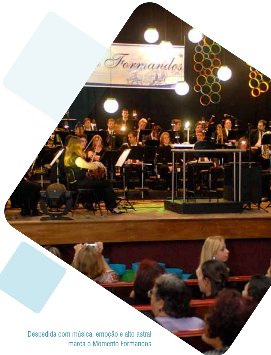
Despedida com música, emoção e alto astral marca o Momento Formandos

A PUCRS acompanha o estudante desde a escolha da profissão até a sugestão de opções para sua educação continuada. No programa Futuros Calouros, iniciativas como visitas ao Campus Central e à Feira das Profissões orientam alunos do ensino médio e pré-vestibulandos. Durante o Concurso Vestibular, o Projeto Acalanto tem atividades para familiarizar candidatos e seus acompanhantes com a Universidade. Já os ingressantes contam com o Stand Calouros, que promove integração e informação sobre a Instituição, e apresenta a Administração Superior.