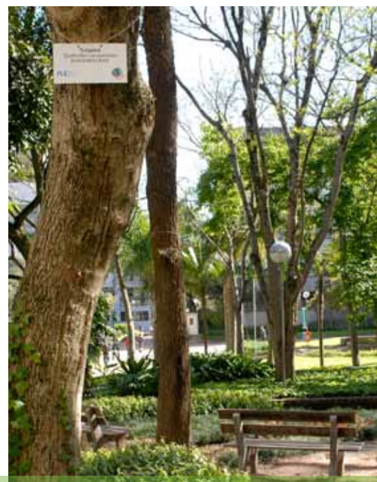
Comunidade universitária pode conhecer melhor as espécies do Campus