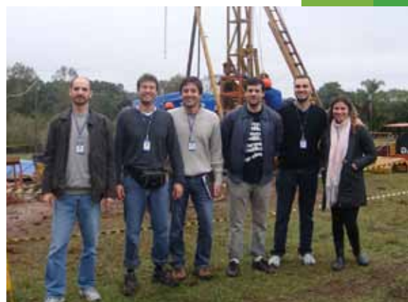
Em Triunfo (RS), pesquisadores estudam novas alternativas para o armazenamento de \text{CO}_2

Em 2009, o Centro iniciou um projeto piloto para armazenamento de gás carbônico em camadas de carvão e para produção de metano. Concentrado na jazida de Charqueadas, no município de Triunfo (RS), o estudo visa a avaliar o potencial de recuperação de metano do carvão e a capacidade de armazenamento de \text{CO}_2 neste meio.