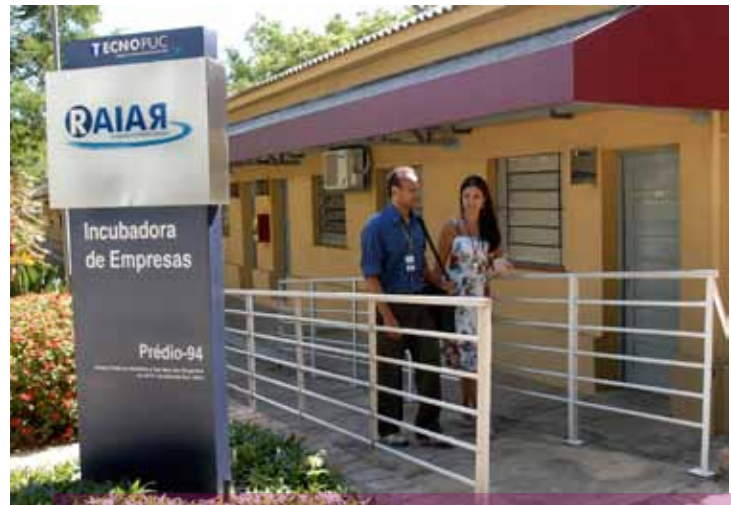
Pré-incubação na Raiar é um dos prêmios oferecidos aos vencedores do Torneio

Com o objetivo de promover a cultura empreendedora e as ideias inovadoras entre os alunos, o Torneio Empreendedor, em sua 3ª edição, em 2009, teve 39 equipes inscritas, de graduação e de pós-graduação. Os 127 acadêmicos, de 22 cursos diferentes, elaboraram plano de negócios e capacitaram-se, sendo selecionados, ao final, dez semifinalistas. Os três primeiros colocados receberam ao todo R$ 19 mil em bolsas de estudos da PUCRS. A terceira edição teve apoio da Agência de Fomento CaixaRS, do Sebrae-RS, do Ideia – Instituto de Pesquisa e Desenvolvimento da PUCRS, e da Fundação Irmão José Otão (Fijo), parceira na categoria Empreendedorismo Social.