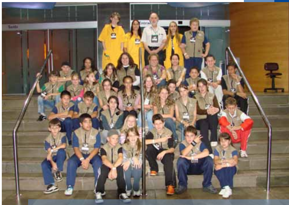
Alunos de escolas públicas tiveram alfabetização científica concluída com Uma Noite no Museu

O projeto Popularização da Ciência por meio da Interação Museu-Escola e Formação de Professores e Comunidade , realizado ao longo de 2009 por professores e licenciandos das Faculdades de Química, Física, Biociências e Matemática e do Polo Educacional do Museu de Ciências e Tecnologia (MCT), resultou numa experiência inédita para 28 estudantes e cinco docentes de escolas públicas do RS. Todos passaram por um processo de alfabetização sobre o universo científico e tecnológico, iniciado em Capela de Santana e Lindolfo