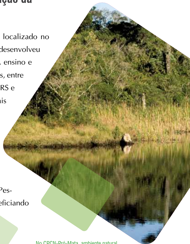
No CPCN-Pró-Mata, ambiente natural preservado subsidia atividades acadêmicas

No ano de 2009, o CPCN Pró-Mata, localizado no município de São Francisco de Paula (RS), desenvolveu diversas atividades relacionadas a pesquisa, ensino e extensão, recebendo mais de 1.800 visitantes, entre professores, alunos e pesquisadores da PUCRS e de outras instituições conveniadas nacionais e internacionais. No local foram identificadas mais de 300 espécies de aranhas, 380 de borboletas, 191 de abelhas, 248 de aves, além de moluscos, anfíbios, mamíferos, e mais de 500 espécies de plantas. Nas melhorias em infraestrutura, destacam-se a construção da nova Casa de Pesquisa e a implantação de rede wireless , beneficiando todos os visitantes e demais usuários.