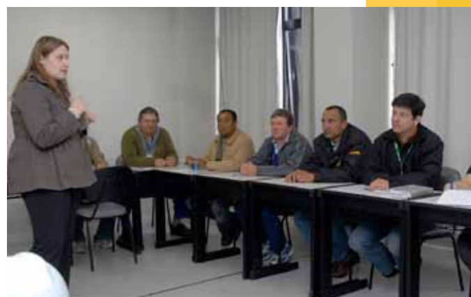
Mestres de obra assistiram a palestra sobre diversidade no ambiente de trabalho