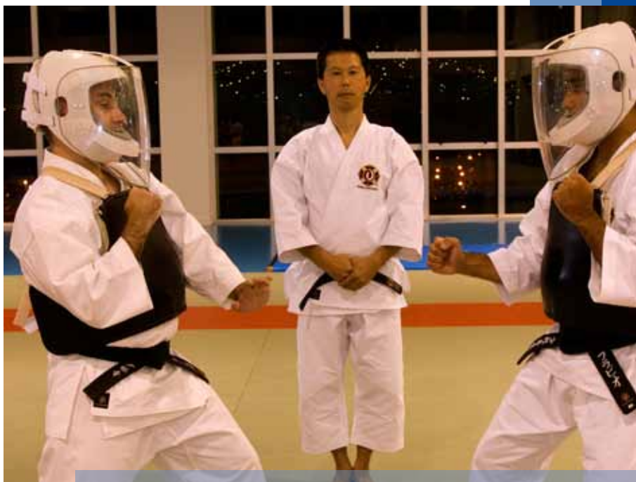
Curso de Shorinji Kempo foi ministrado no Parque Esportivo da PUCRS

Cursos de língua japonesa, culinária, cerâmica, origami , bonsai e artes marciais são algumas das atividades oferecidas pelo Instituto de Cultura Japonesa. O Instituto conta com o único computador com software em japonês da Universidade, atraindo intercambistas vindos do Japão. Uma das atividades promovidas em 2009 foi o curso de Shorinji Kempo, arte marcial japonesa criada em 1947 pelo mestre Doshin So. Trata-se de uma disciplina para o treinamento da mente e do corpo que visa ao benefício de três áreas da vida: autodefesa, desenvolvimento espiritual e melhoria da saúde. Ao todo, houve 23 cursos de extensão, com 267 participantes.