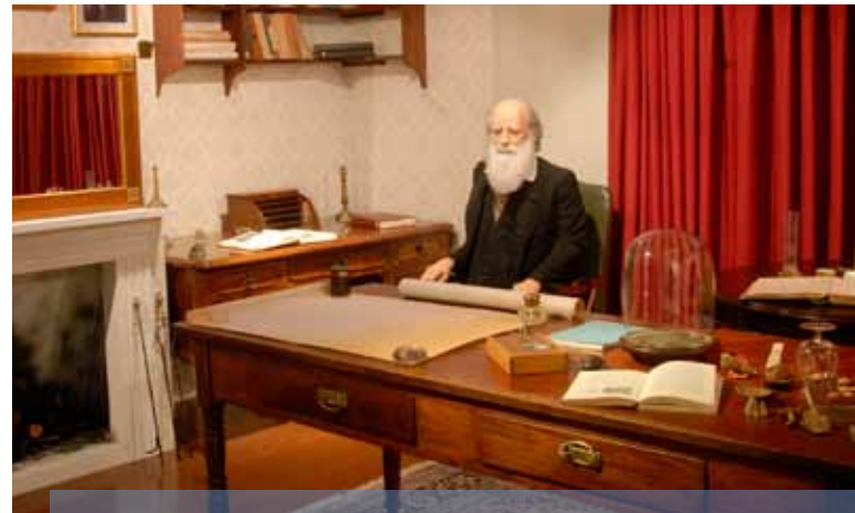
Reprodução do escritório de Charles Darwin foi uma das atrações da exposição organizada em 2009

A área de exposição pública permanente, com mais de 10 mil metros quadrados, tem cerca de 750 equipamentos. Em 2009, o principal destaque foi a mostra (R)Evolução de Darwin , celebrando os 200 anos do naturalista inglês.