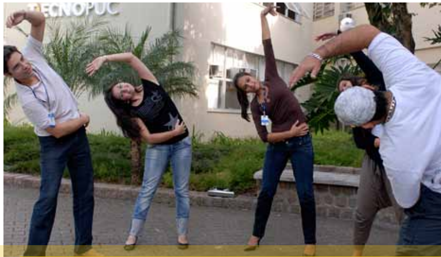
Atividades físicas orientadas ocorrem em ambientes internos e ao ar livre

O projeto ErgonoMico, de Ginástica Laboral, visa ampliar a qualidade de vida no trabalho para os funcionários da PUCRS e oportunizar aos alunos da Faculdade de Educação Física e Ciências do Desporto aproximação com a prática profissional. Em 2009, a ação foi desenvolvida em 66 setores da Universidade.