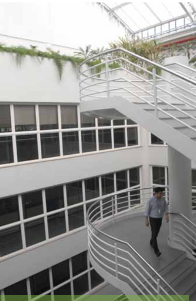
Prédio da Faculdade de Informática, no Campus, privilegia entrada de luz natural

O Grupo USE é composto por profissionais da Pró-Reitoria de Administração e Finanças, da Prefeitura Universitária, da Divisão de Obras e das Faculdades de Engenharia e de Arquitetura e Urbanismo.