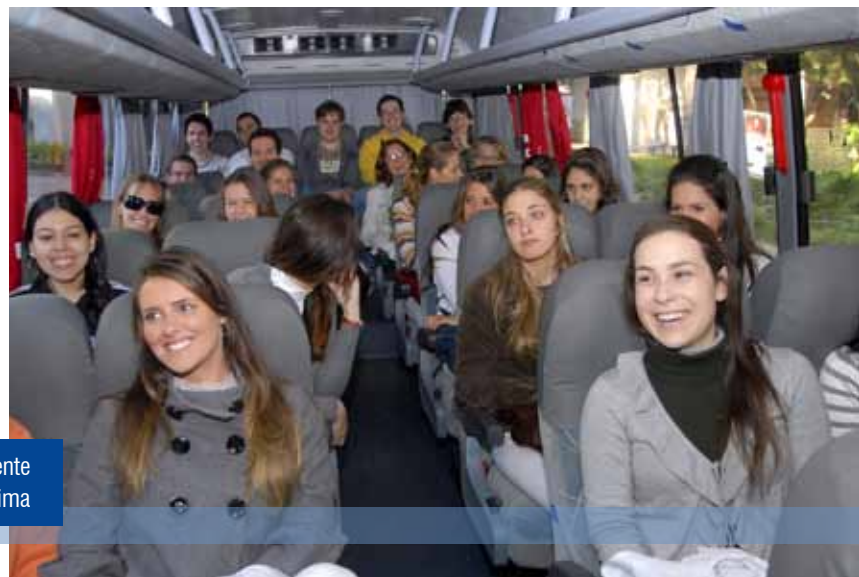
Estágios curriculares levam dezenas de alunos diariamente para a realização de atividades na Vila Fátima