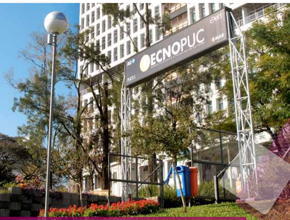
Ao fundo, as obras do Portal Tecnopuc, que duplicará o espaço físico disponível para atuação de novas empresas e projetos de pesquisa