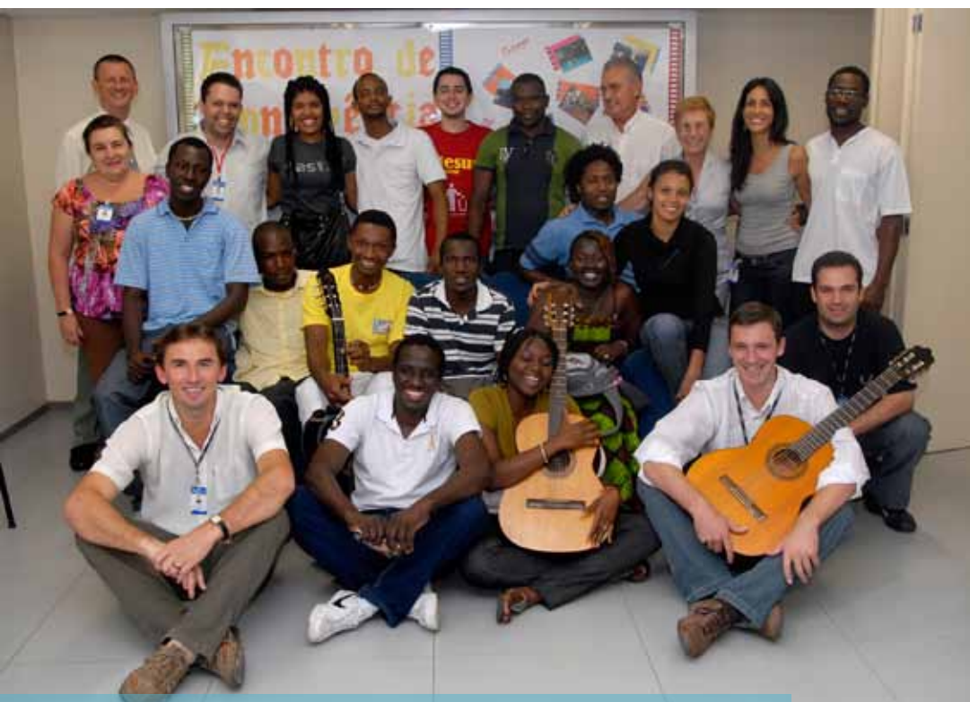
Alunos africanos do PEC-G em recepção organizada pela Pró-Reitoria de Assuntos Comunitários e pelo Centro de Pastoral e Solidariedade

Atividade realizada com países em desenvolvimento com os quais o Brasil mantém acordo de cooperação educacional, cultural ou de ciência e tecnologia. Tem como finalidade proporcionar a formação, em nível de pós-graduação, de pessoas oriundas de nações em desenvolvimento, para estudar em universidades brasileiras. A iniciativa é administrada pelo Ministério das Relações Exteriores, Capes e CNPq.