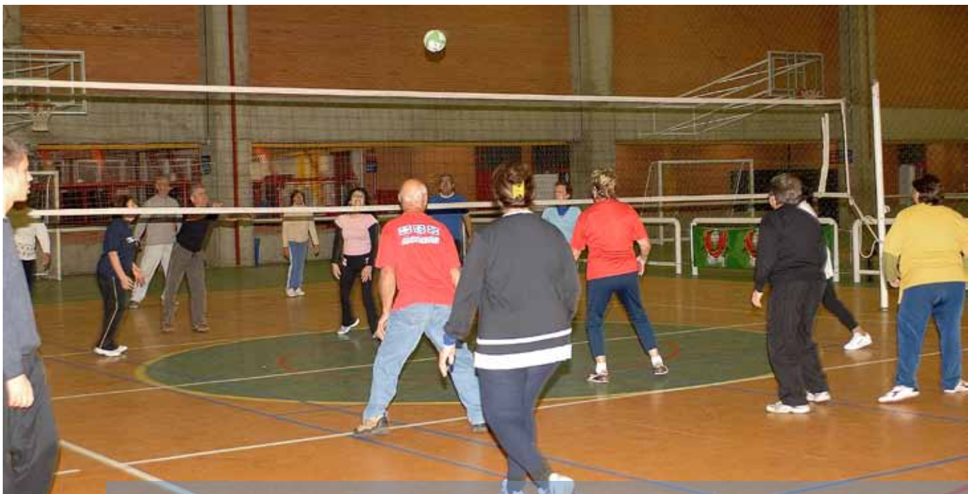
Prática de esportes coletivos de idosos é orientada e acompanhada por especialistas

Assistência à saúde, jurídica e social foram alguns dos serviços oferecidos pelo Centro de Extensão Universitária Vila Fátima aos 45 idosos que participaram do Programa da Terceira Idade em 2009. No Parque Esportivo da PUCRS, as atividades são acompanhadas por alunos, sob a orientação de professores da Faculdade de Educação Física e Ciências do Desporto. As ações são promovidas em parceria com o Instituto de Geriatria e Gerontologia da PUCRS.