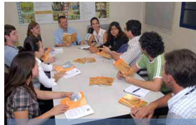
Centro de Pastoral e Solidariedade integra universitários cultivando a fé e valores éticos

Visa à construção da cultura da solidariedade no meio universitário a partir da criação e articulação de iniciativas em favor de pessoas, instituições e comunidades em situação de vulnerabilidade social, com a proposta de inclusão social e transformação da realidade. Fazem parte desse programa os projetos Sinergia Digital, Semana da Solidariedade, Voluntariado e Campanhas Solidárias, como a coleta de agasalhos.