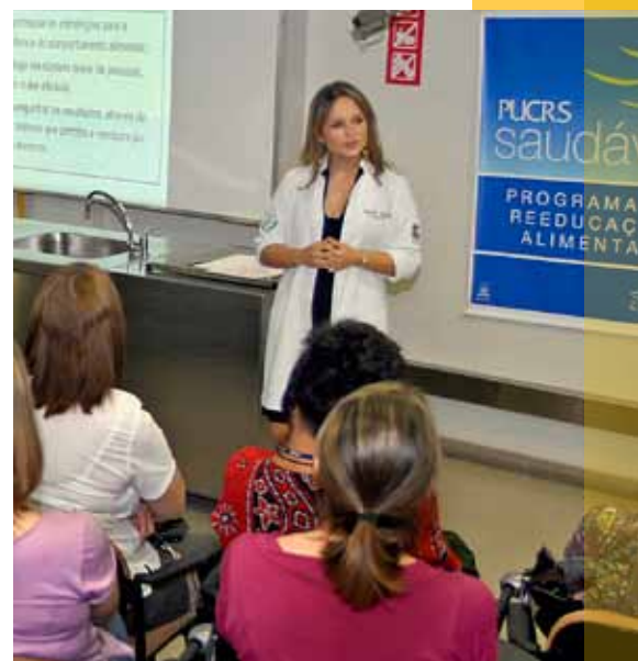
Encontros incentivam para a melhoria dos hábitos alimentares

A Universidade conta com o Programa de Reeducação Alimentar, voltado para técnicos administrativos e professores. Nos encontros, quinzenais, são abordados temas ligados à alimentação saudável, como elaboração de receitas práticas para o dia a dia, alimentação voltada à atividade física, interpretação de rótulos de alimentos. A atividade é coordenada pela Faculdade de Enfermagem, Fisioterapia e Nutrição (Faenfi) em parceria com a Pró-Reitoria de Assuntos Comunitários e a Gerência de Recursos Humanos. No ano de 2009, foram atendidos 92 funcionários.