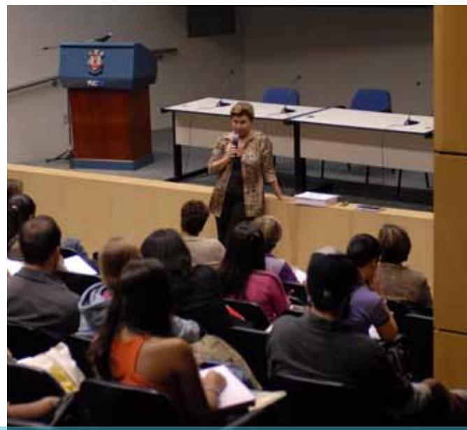
Encontro da Capacitação Discente, em abril, abordou o Novo Acordo Ortográfico

O projeto Capacitação Discente consiste num ciclo de palestras sobre temas contemporâneos, relacionados à vida profissional e à participação responsável na sociedade. Tem como objetivos, entre outros, contribuir para a qualificação da formação integral do acadêmico, para um maior conhecimento da Universidade e para o aprimoramento da formação geral. Os encontros têm periodicidade mensal, ocorrendo na última segunda-feira de cada mês, com duração de uma hora – das 18h às 19h. A dinâmica prevê palestra com 45 minutos de duração e 15 minutos para debate da plenária com o(s) palestrante(s). Em 2009, foram realizados sete encontros, totalizando 545 alunos participantes.