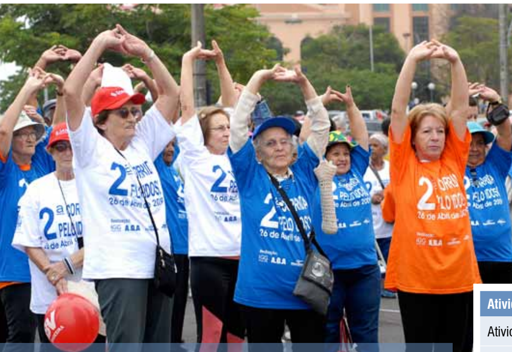
2.ª Corrida pelo Idoso integrou atividades do Programa Geron em 2009