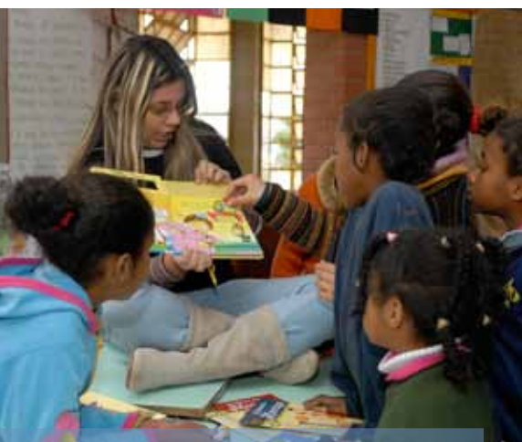
Na Missão Vila Fátima, crianças da comunidade ouvem histórias infantis contadas por alunos