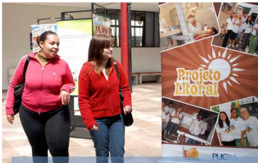
Estudantes visitaram a Mostra de Responsabilidade Social