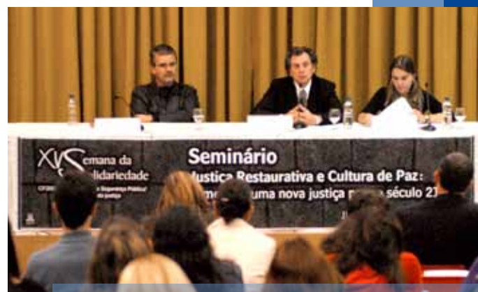
Seminário Justiça Restaurativa e Cultura de Paz integrou a programação da 15.ª Semana da Solidariedade

A 15ª Semana da Solidariedade, realizada pela Pastoral em parceria com diversas instituições, ocorreu entre os dias 16 e 22 de maio. Palestras, minicursos gratuitos com noções para o mercado de trabalho, exposições, oficinas e seminários abertos à comunidade fizeram parte da programação, baseada no tema A paz é fruto da justiça , lema da Campanha da Fraternidade 2009. Na Feira da Promoção da Saúde, o público teve acesso a avaliações de saúde cardiovascular, bucal e dermatológica, além de orientações sobre a importância de exercícios físicos e sobre a saúde da mulher, entre outras.