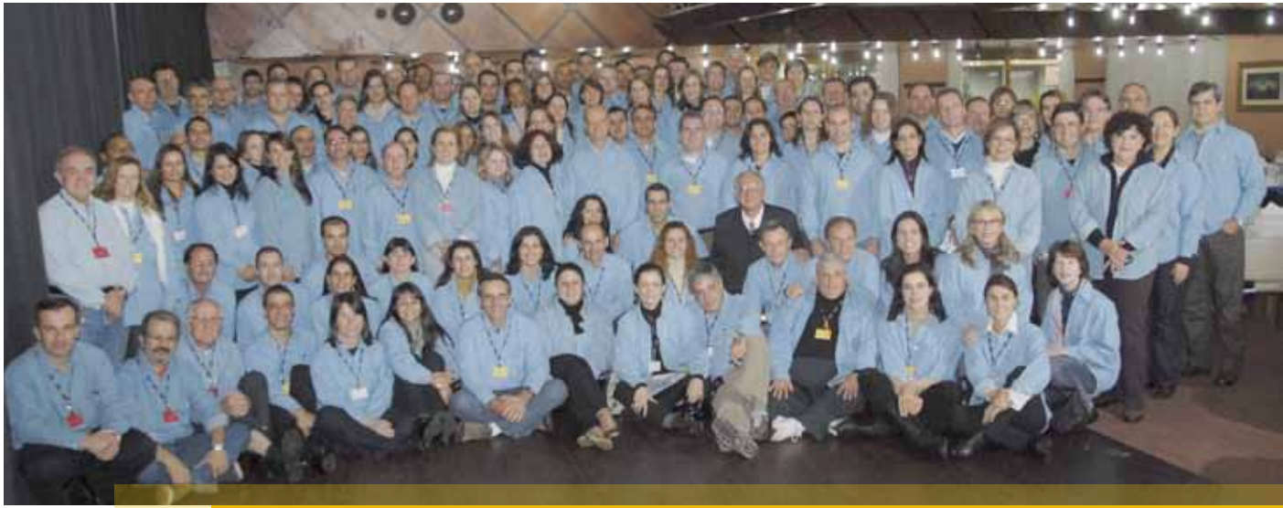
Encontro O Olhar , no Hotel Dall'Onder, em Bento Gonçalves, reuniu professores e técnicos administrativos