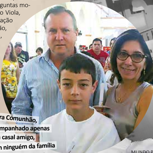
Na Primeira Comunhão,

Nas pesquisas realizadas pelo grupo liderado por Grassi, as negligências sofridas sistematicamente durante a infância tiveram tantos ou mais efeitos negativos na vida adulta do que abusos físicos e sexuais, tornando a pessoa mais vulnerável, no futuro, ao desenvolvimento de doenças. Negligenciar é privar a criança de alimentos, vestuário ou condições de saúde ou de afeto e carinho. Os estudos mostraram que mulheres deprimidas e usuárias de crack com histórico de omissões quando crianças tiveram mais dificuldade de superar o sofrimento. Enquanto o abuso sexual, por exemplo, em média, começa aos 6 ou 7 anos, muitas vezes a negligência (ou desamor) já se dá desde o pré-natal.