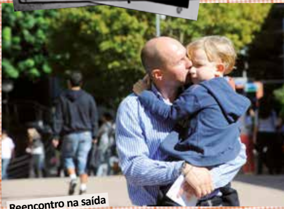
Reencontro na saída do trabalho e do colégio