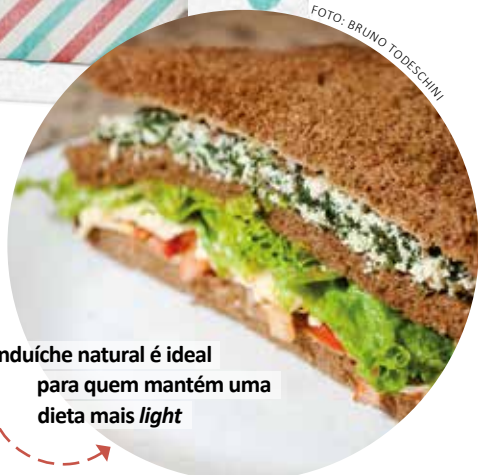
Sanduíche natural é ideal para quem mantém uma dieta mais light

No Ponto Onze (prédio 11), quem tem intolerância à lactose pode escolher entre um mexicano vegetariano ou pastéis de forno como o de tofu. No bar do prédio 15 , as alternativas para quem precisa controlar o glúten são chocolate e pastéis integrais em sabores variados: espinafre, carne, queijo, brócolis, palmito e frango.