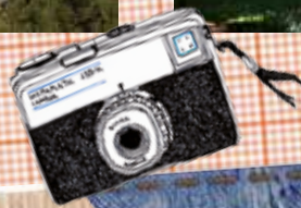
“Como ficaremos na foto?”