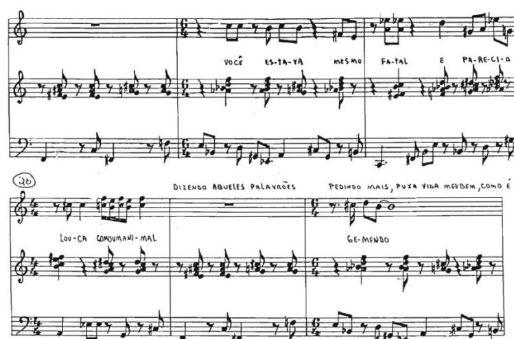
Ilustração: Partitura musical Orgasmo Total - compassos 24 a 28