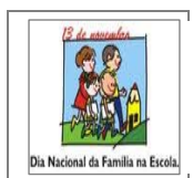
Figura 1: Logotipo da Campanha Nacional (MEC: 2001)

No Brasil, as famílias estão pouco presente nas escolas. Algumas campanhas ainda tímidas foram lançadas pelo governo Brasileiro no ano de 2001. Pela televisão divulgou-se a campanha “Dia Nacional da Família na Escola”. As atividades deste dia foram de competência de cada instituição pública, na campanha, pais, alunos e professores pintaram e limparam as escolas.