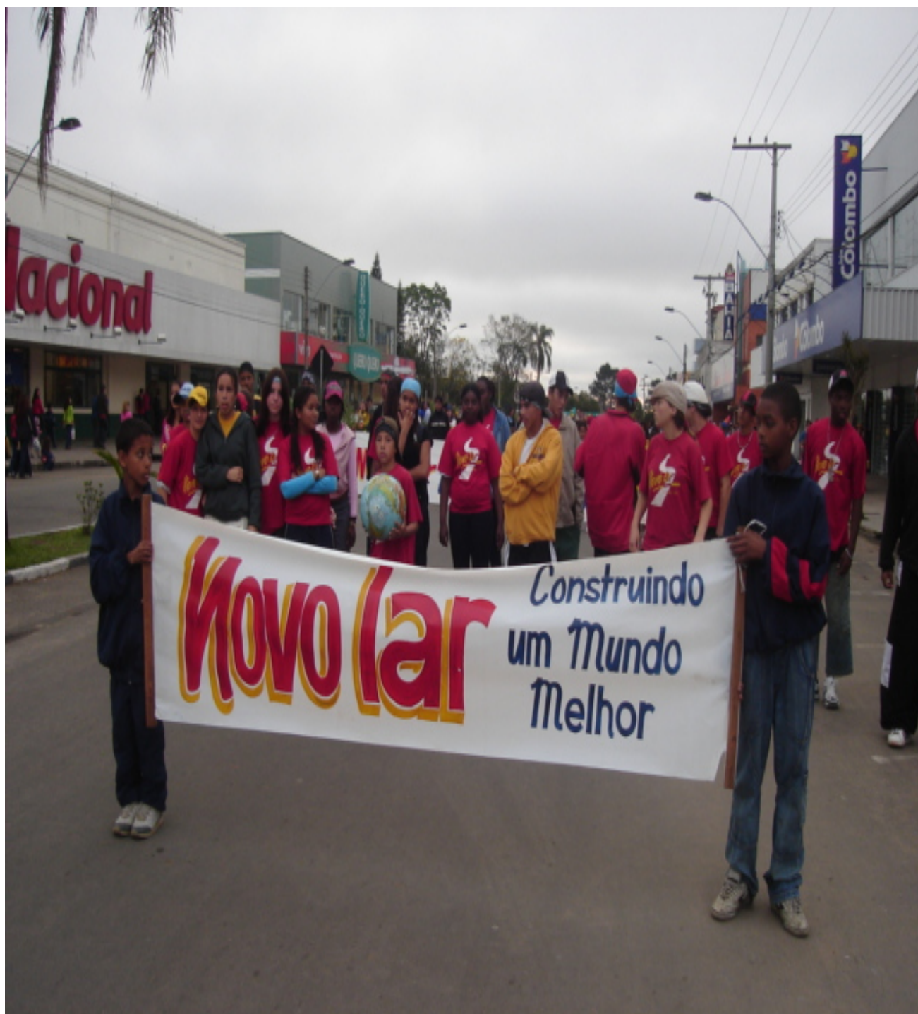
Figura 18 – Tessituras Finais