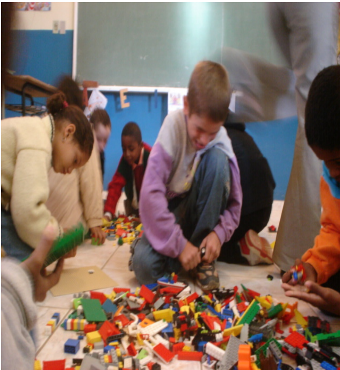
Figura 12 – Educador Perseverante