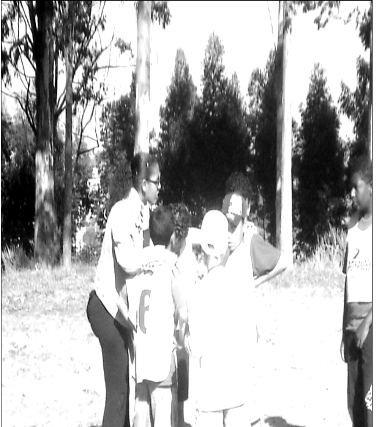
Figura 6 – Educadora Ouvidora