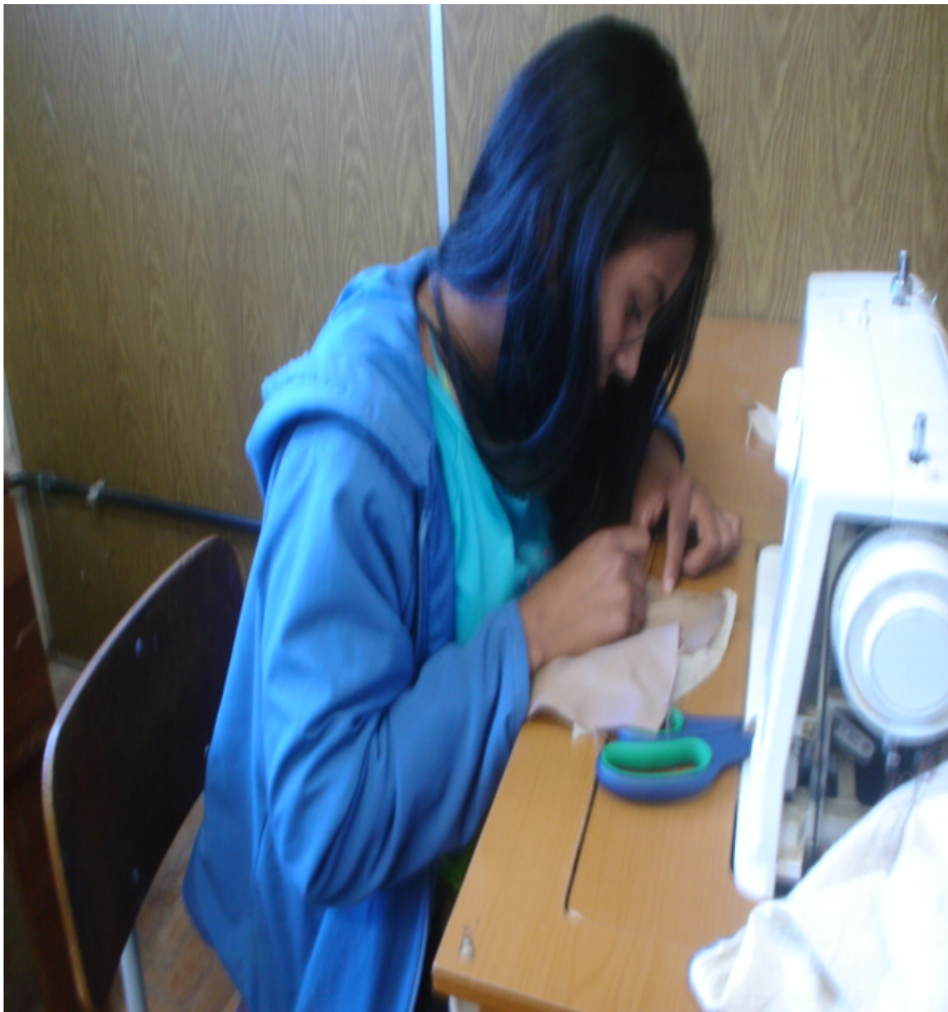
Figura 4 – Educadora Aprendizete