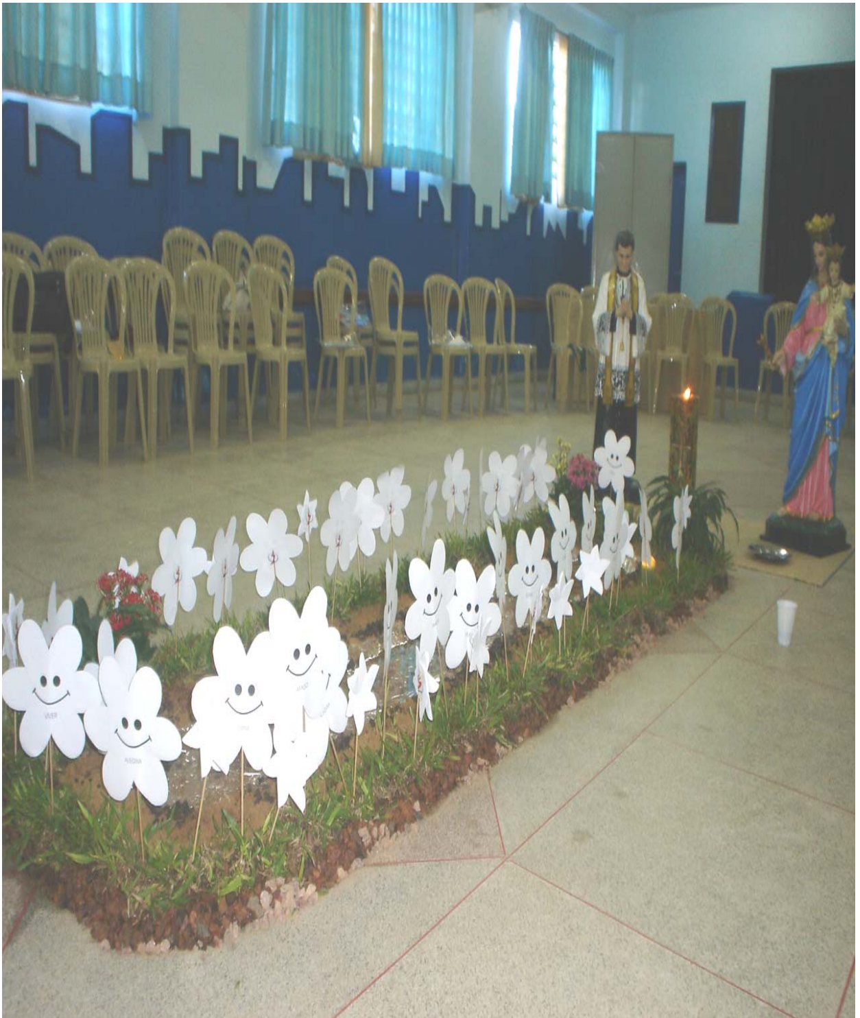
Figura 10 – Professora Pastora