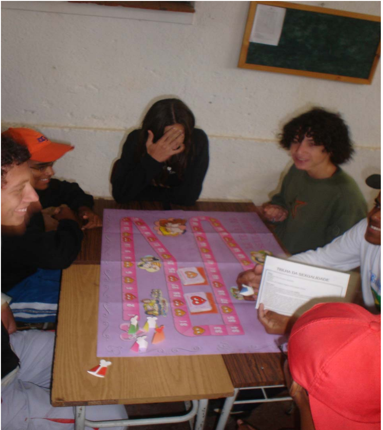
Figura 8 – Educadora Trabalhadora