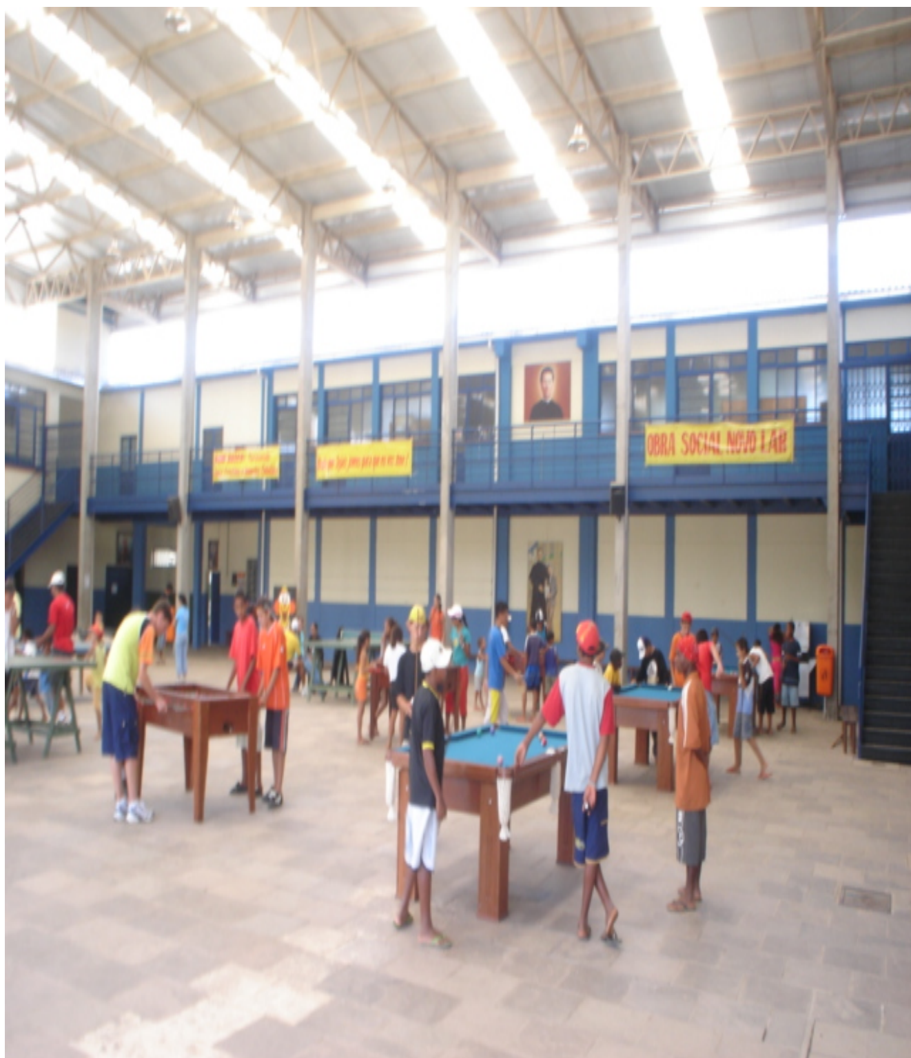
Figura 2 – Educador Presença