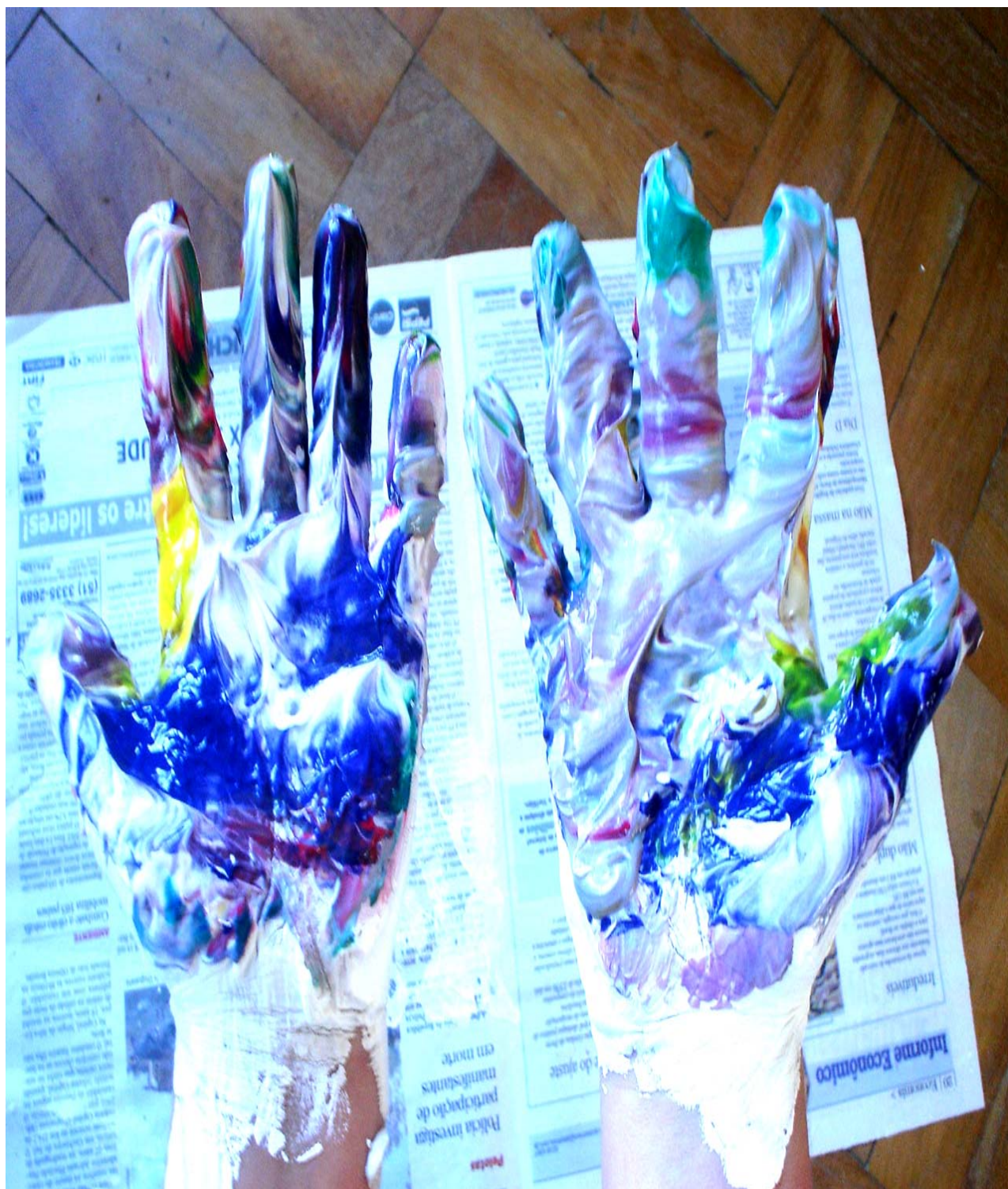
Figura 5 – Educador Transformador