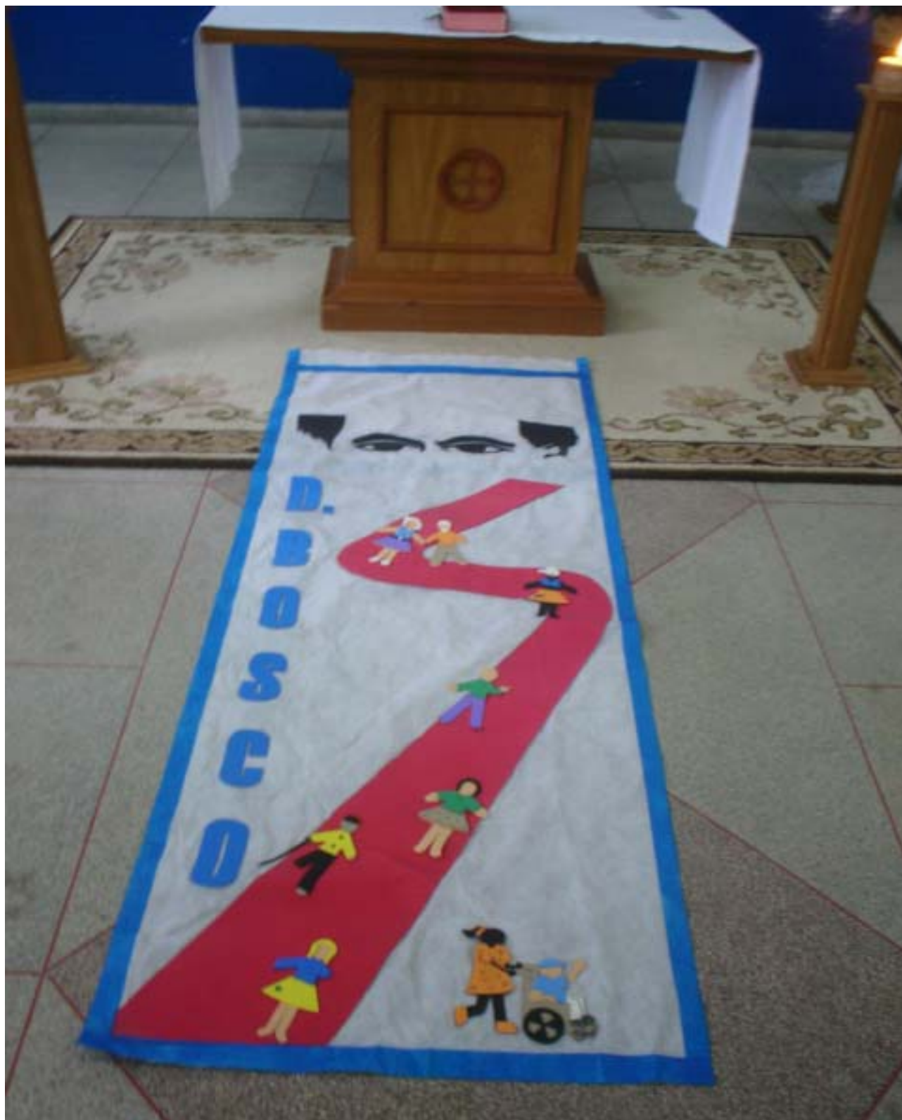
Figura 11 – Educadora Comprometida