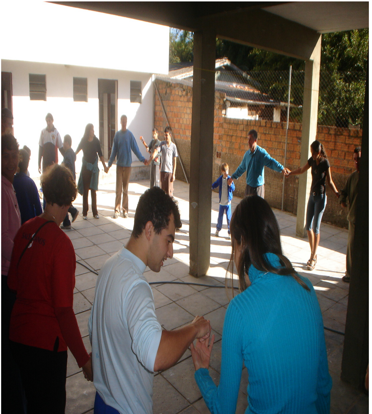
Figura 1 – Educadora Solidária