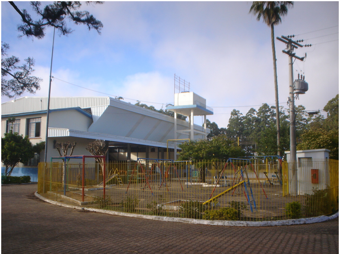
Figura 16 – Novo Lar de Menores