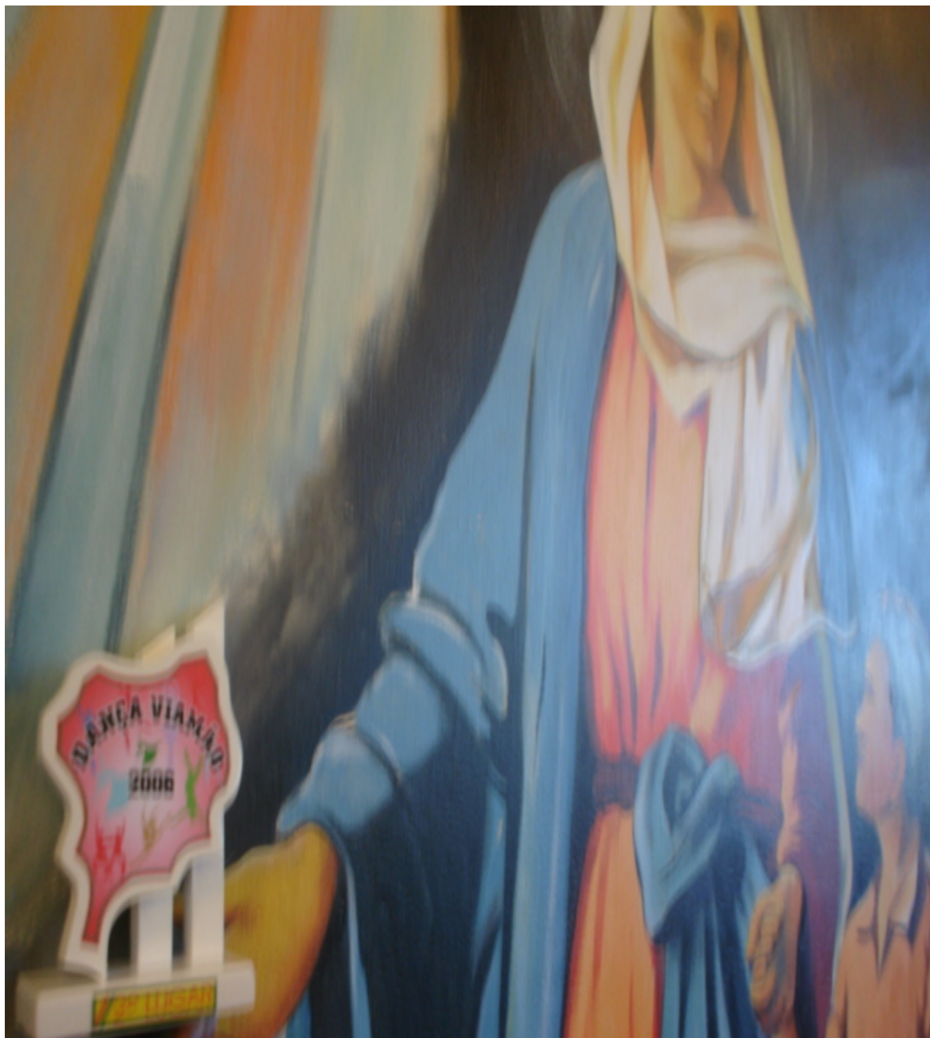
Figura 7 – Educador Lutador