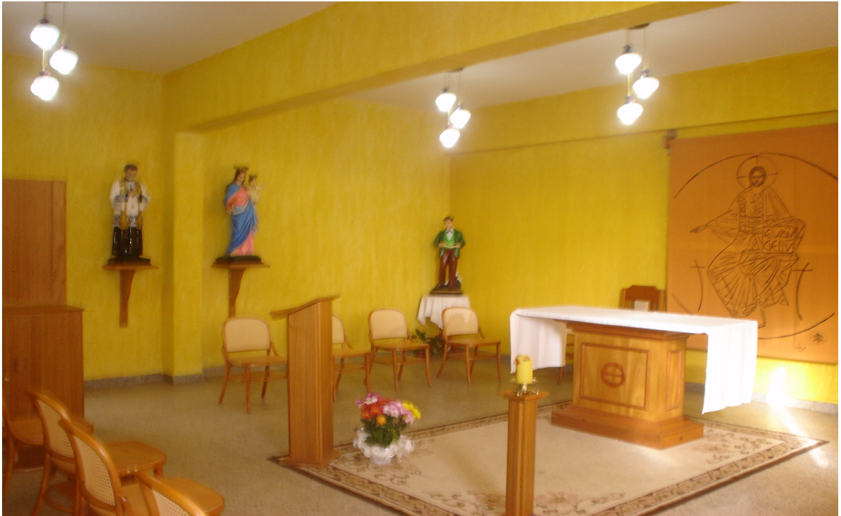
Figura 14 – Educador Amoroso