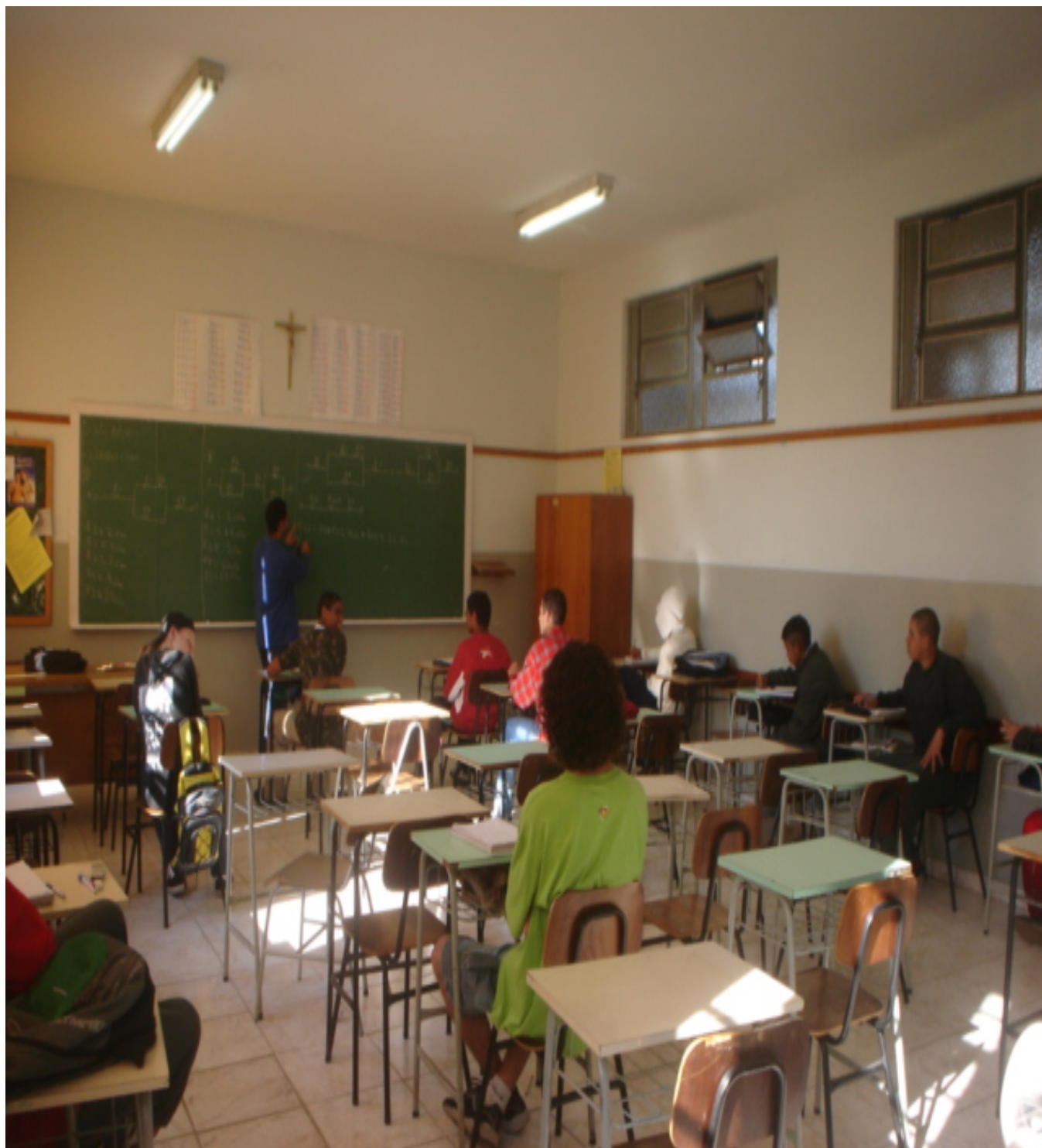
Figura 3 – Educador Tecnícista