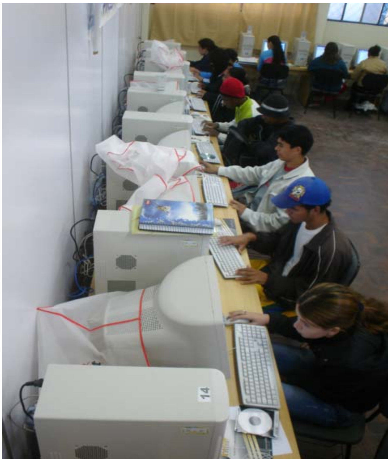
Figura 13 – Educadora Perfeccionista