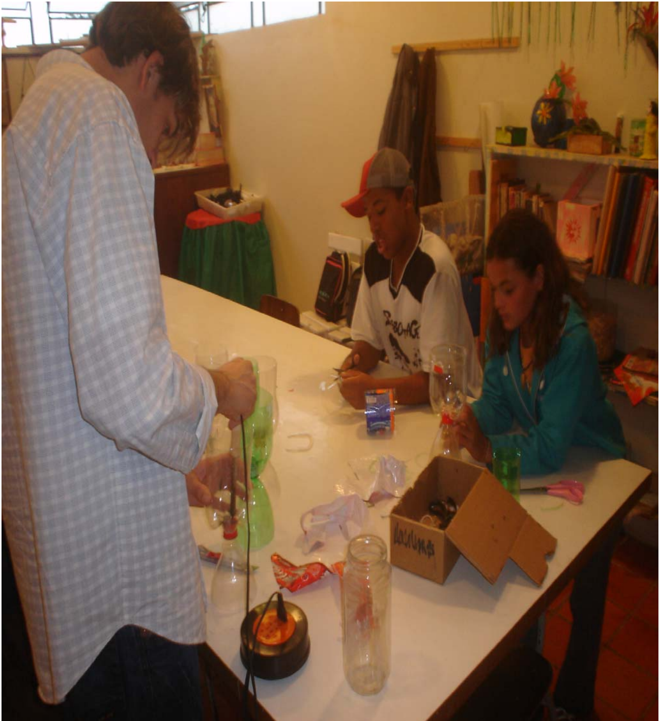
Figura 9 – Educadora Orientadora