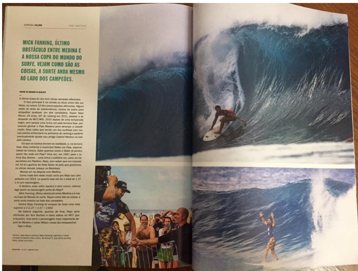
Figura 18 - Pipe Masters parte 4