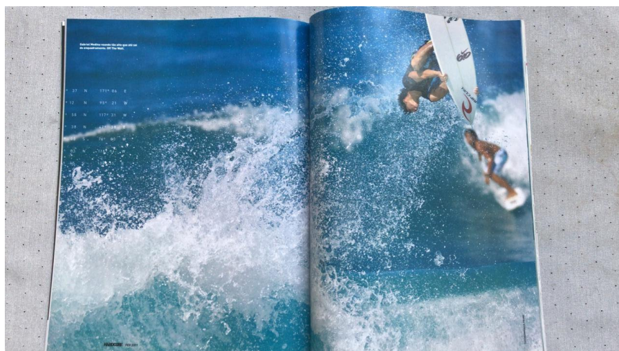
Figura 3 - Imagem dupla na revista Hardcore