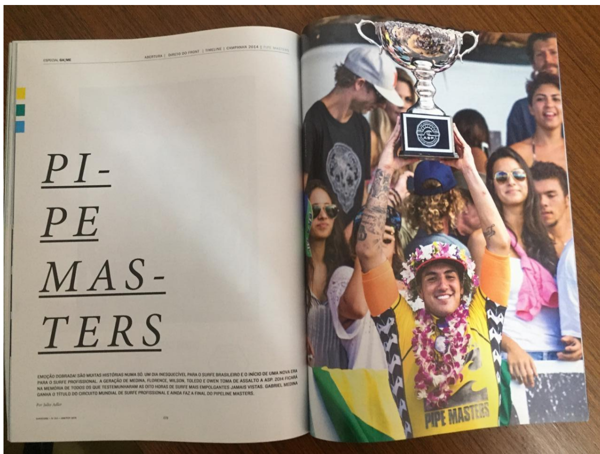
Figura 14 - Pipe Masters