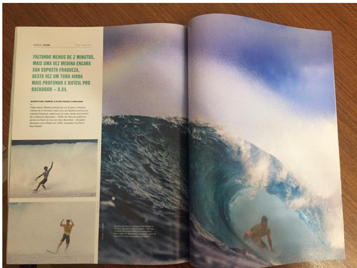
Figura 17 - Pipe Maters parte 3