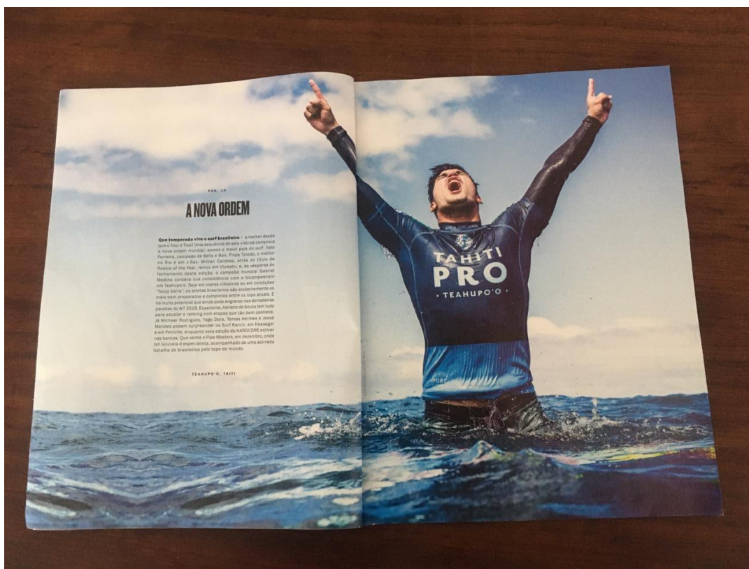
Figura 22 - A nova ordem