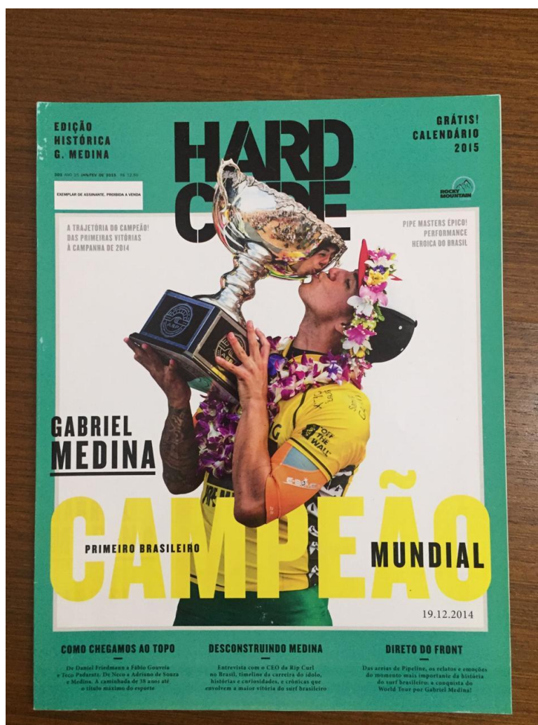
Figura 13 - Nona capa de Gabriel Medina na revista Hardcore