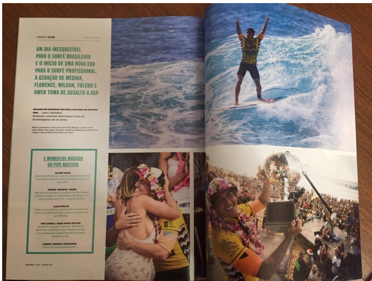
Figura 20 - Pipe Masters parte 6