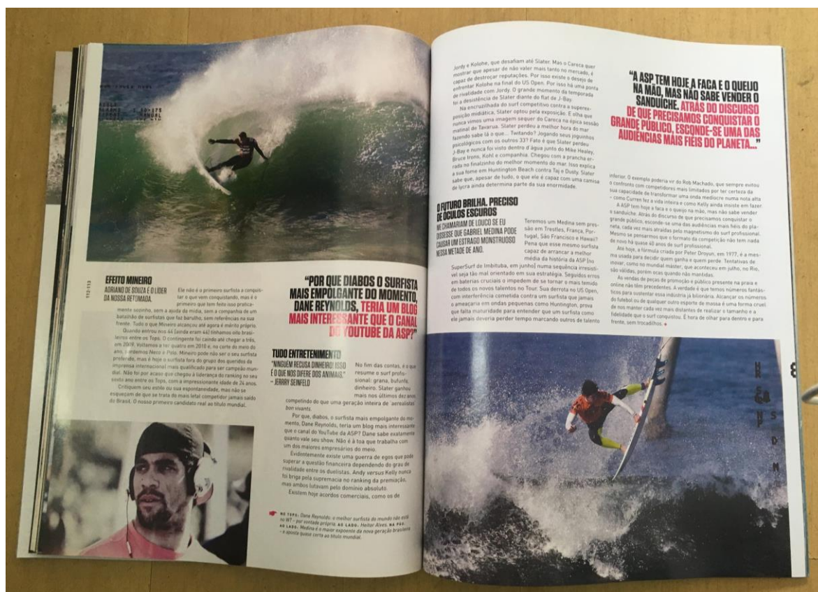
Figura 6 - Menção em matéria da revista Hardcore

circuito de surfe do mundo. “No caminho do brazuca estão baterias contra pesos-pesados em cinco etapas do Tour: Trestles, França, Portugal, São Francisco e Hawaii” (GUEIROS, 2011, p. 47). Para Martínez (2004), que em sua obra aborda a jornada do herói aplicada ao jornalismo, esta seria a quinta etapa, onde o herói terá a oportunidade de crescer diante de grandes desafios. Medina, o herói, terá de vencer grandes surfistas e nomes consagrados em algumas das praias mais famosas do mundo, palcos icônicos do esporte.