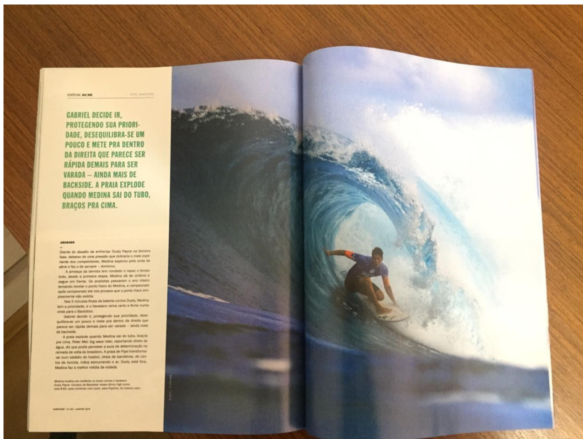
Figura 16 - Pipe Masters parte 2

precisa vencer seu último desafio, onde ele deve ultrapassar a significação de ícones para voltar como um herói de fato.