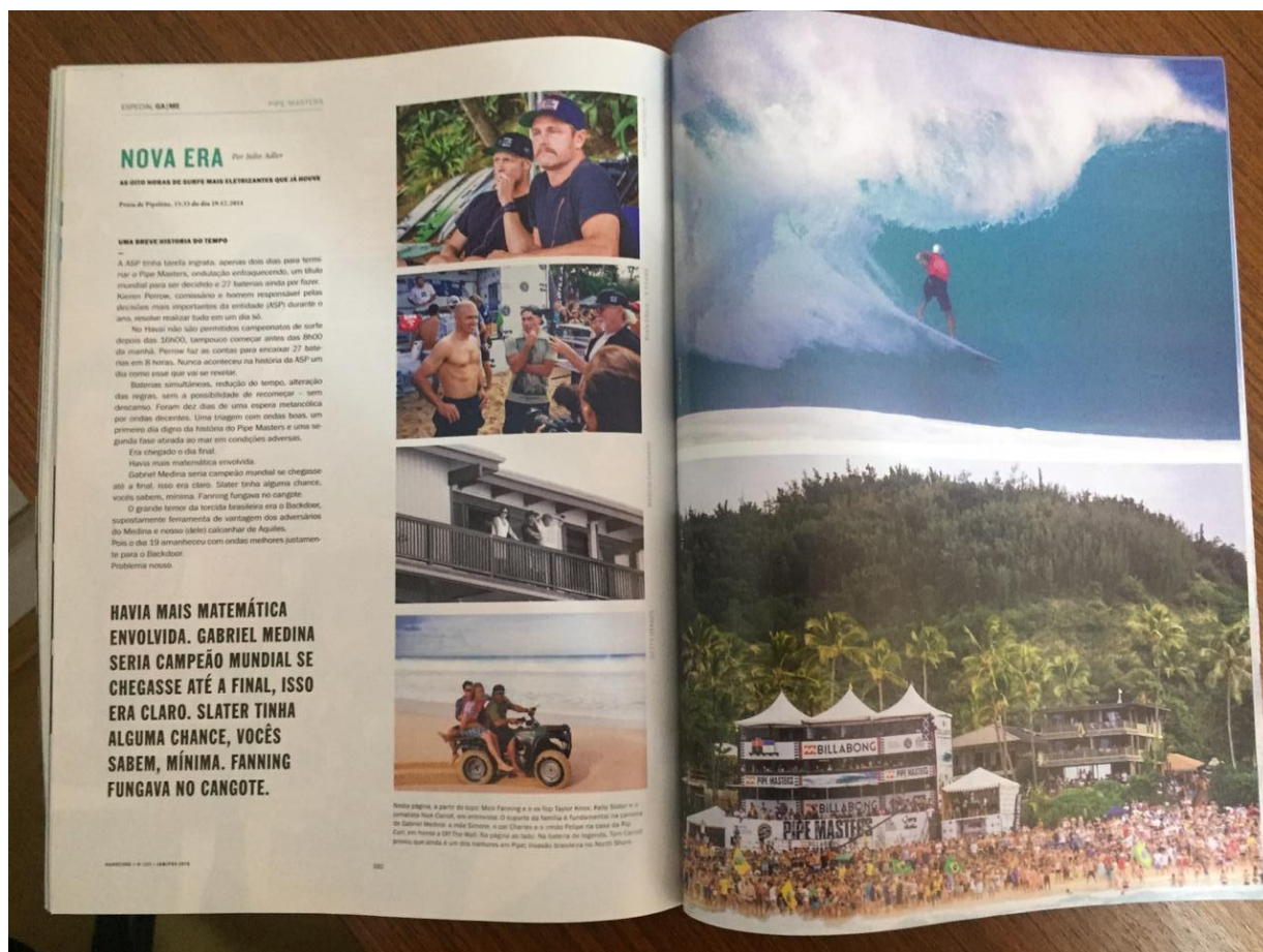
Figura 15 - Pipe Masters - parte 1