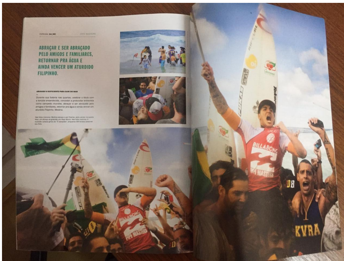
Figura 19 - Pipe Masters parte 5