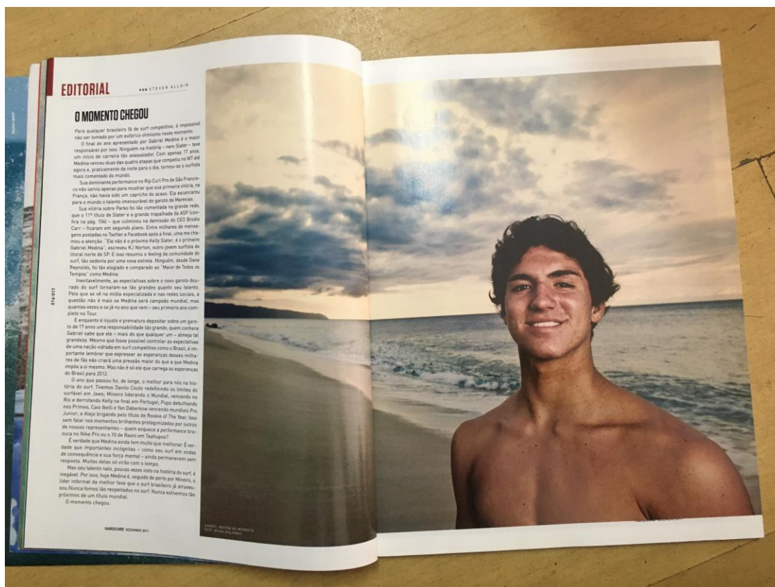
Figura 8 - Editorial da edição 267 da Revista Hardcore