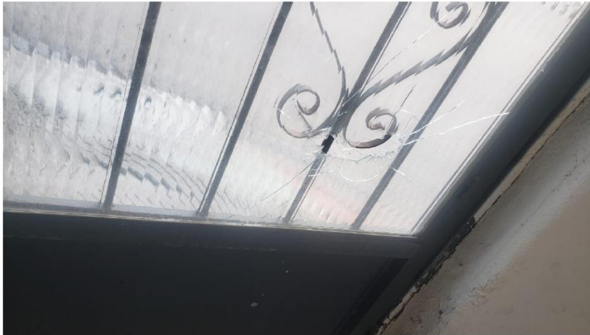
Casas seguem com marcas dos tiroteios

traficantes e milicianos, pelo contrário, a polícia acaba sendo parte do processo”, complementa.