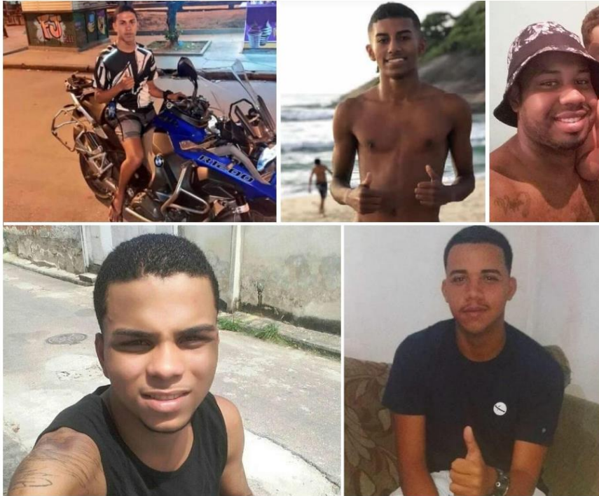
Cinco jovens negros morreram nas ações da PM

Em meio a pandemia da Covid-19, moradores da favela Vila Kennedy, em Bangu, zona oeste da cidade do Rio de Janeiro, sofrem também com as operações do 14º Batalhão da Polícia Militar (Bangu). De acordo com eles, os tiroteios são recorrentes e cinco pessoas morreram no último domingo (26/4). Segundo a polícia, o objetivo era acabar com o evento que acontecia no local.