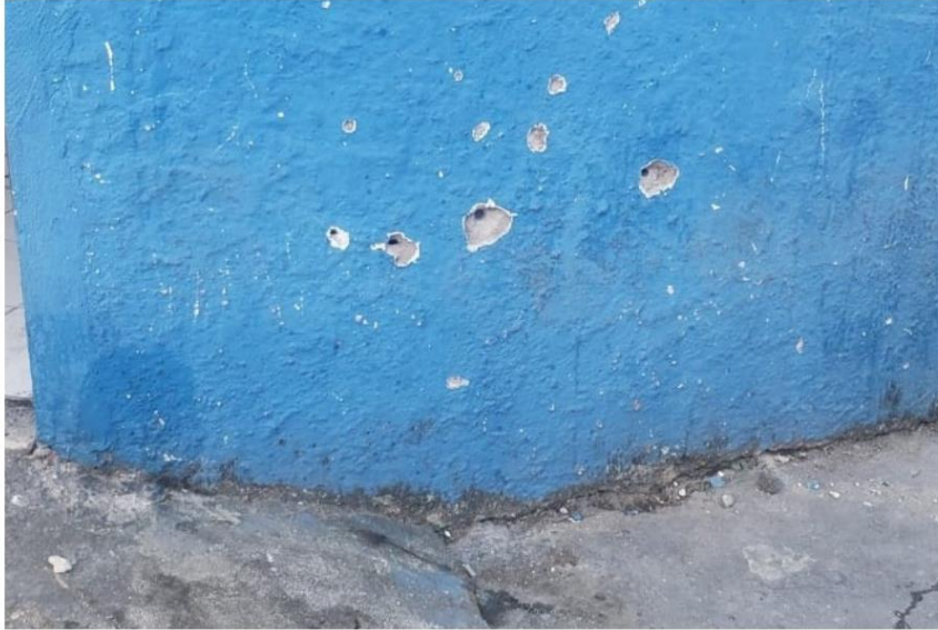
Marcas de disparos dos policiais, segundo moradores