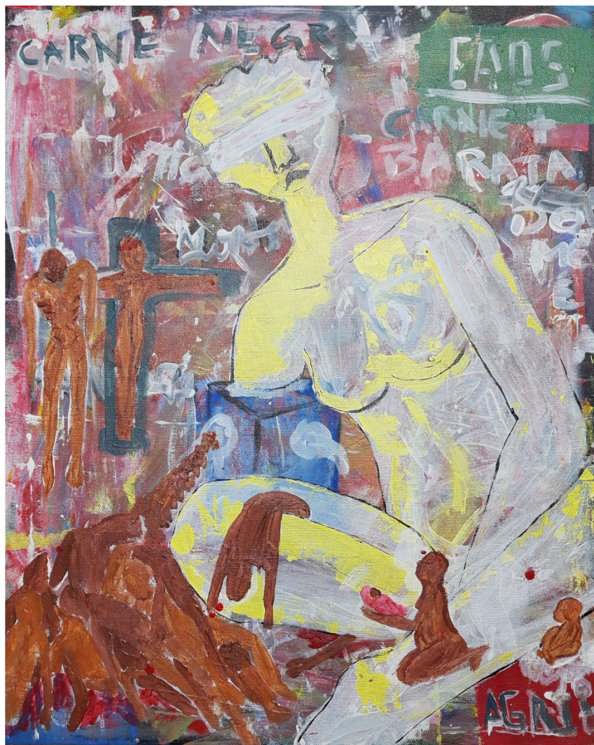
Jacarezinho, 2021, acrílica sobre tela - Renata Campos (@re.agri)