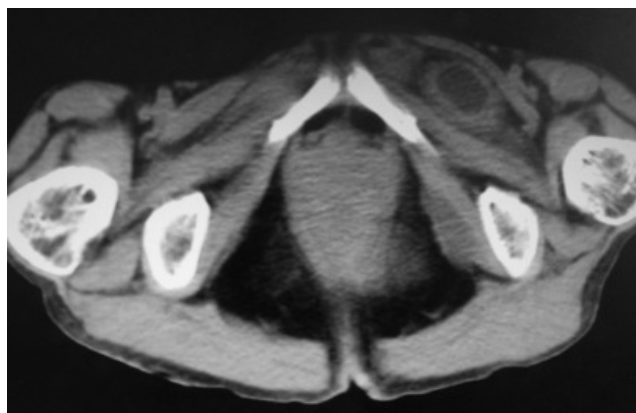
Figura 1. Tomografia computadorizada de abdome e pelve, mostrando massa com conteúdo líquido entre os músculos pectíneo e obturador externo esquerdo, identificando defeito no forame obturador com alça de intestino delgado encarcerada.

A paciente evoluiu muito bem no pós-operatório, recebendo alta no quinto dia após a cirurgia. Após seis meses, durante os quais realizou três consultas de revisão no ambulatório de cirurgia geral, recebeu alta ambulatorial.