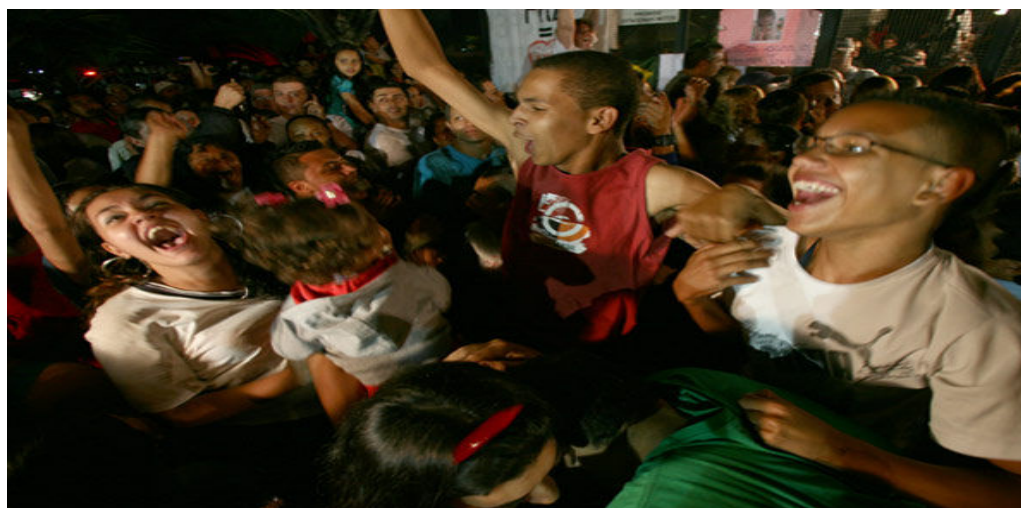
Figura 3: A sentença, proferida por volta das 0h40min, foi comemorada por cerca de 200 pessoas que acompanhavam a movimentação do julgamento

Cerca de dois anos após a ocorrência do fato, em 22 de março de 2010, os acusados foram a júri popular no Fórum de Santana, zona norte de São Paulo. Na madrugada do dia 27, após cinco dias de julgamento, a sentença: Alexandre Nardoni teve a pena estabelecida em 31 anos, 1 mês e 10 dias de reclusão; Anna Carolina Jatobá, madrasta de Isabella, foi condenada a 26 anos e 8 meses. Ambos ainda cumprirão 8 meses de cadeia pela acusação de fraude processual, pois segundo a promotoria o casal alterou a cena do crime.