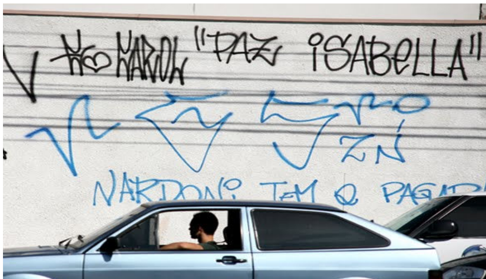
Figura 15: Pichações em muros pedem por paz e justiça para o caso