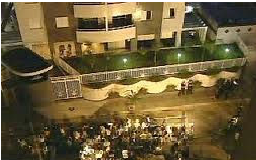
Figura 25: Vista aérea do edifício London durante a reconstituição do crime