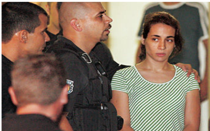
Figura 13: Casal se apresenta no 9º DP

norte, passam pelo 9º Distrito Policial e fazem exames de corpo de delito no Instituto Médico-Legal (IML). Eles são levados para delegacias distintas.