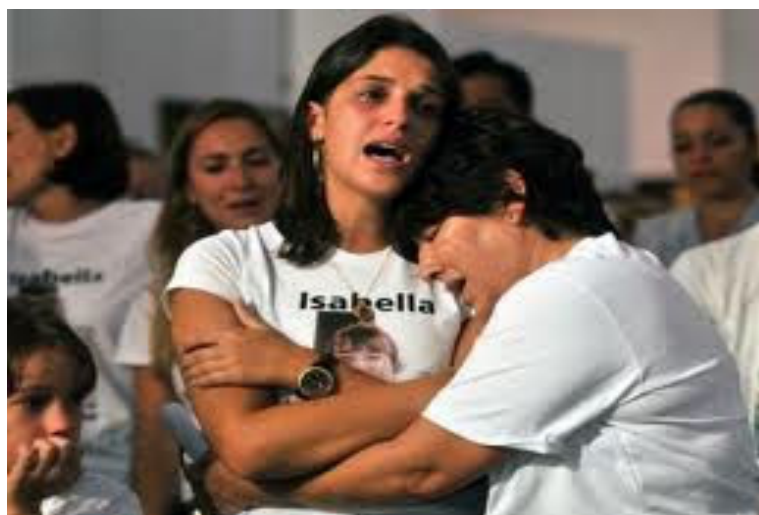
Figura 21: Em missa, mãe de Isabella é consolada por familiares