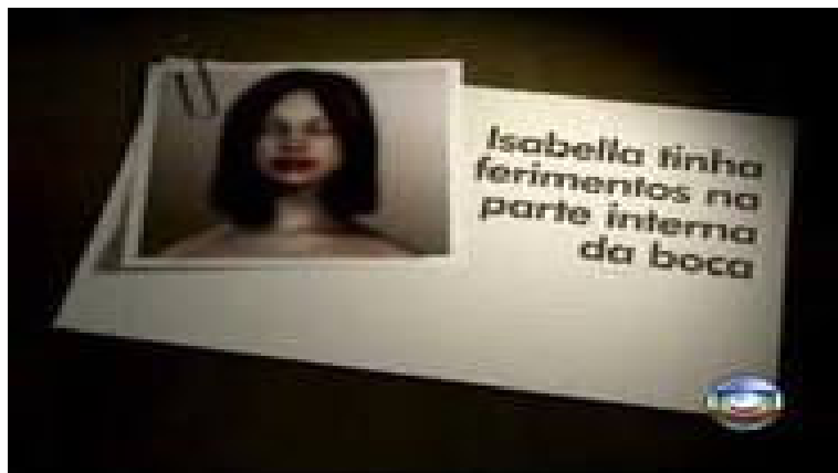
Figura 23: