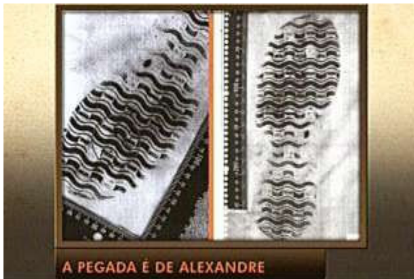
Figura 20: Perícia constata que pegada no lençol é do calçado de Alexandre