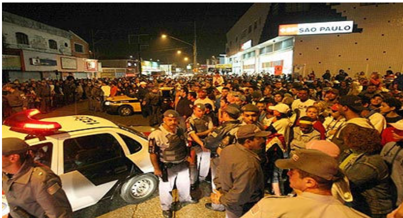
Figura 17: Multidão protestou contra a soltura do casal