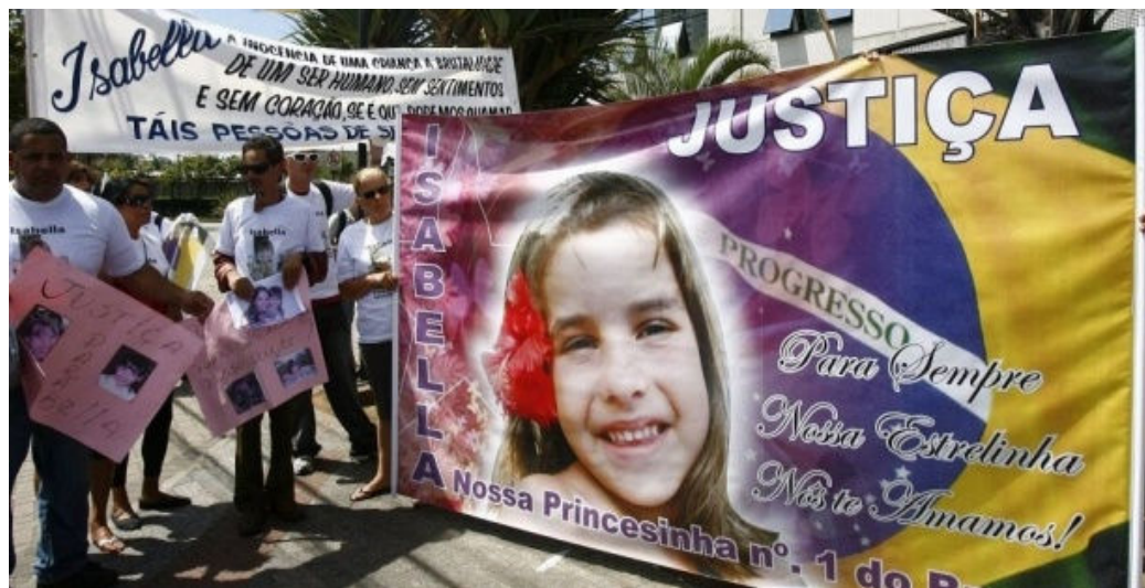
Figura 4: Manifestação de populares em frente ao Fórum de Santana