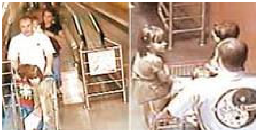
Figura 16: Imagens do circuito interno de um supermercado horas antes do crime