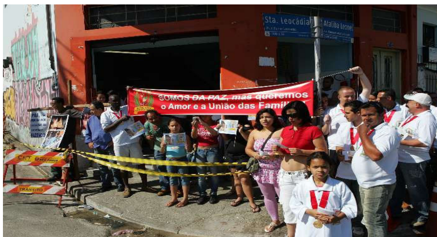
Figura 8: Manifestação de populares durante a reconstituição realizada pela Polícia

A cobertura excessiva dos meios de comunicação na investigação policial (inclusive, com acesso de jornalistas a material sigiloso), provocou o interesse da sociedade sobre este fato. A intensidade das imagens reproduzidas pelas emissoras de TV (reconstituindo o crime, inclusive) afetou diretamente o inconsciente das pessoas, sendo que estas reproduções estimularam e deram orientação violenta à multidão.