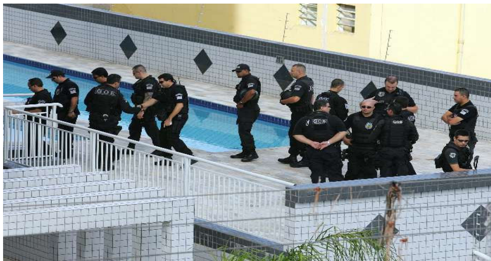
Figura 27: Agentes do Grupo de Operações Especiais (GOE) garantiram a segurança do local