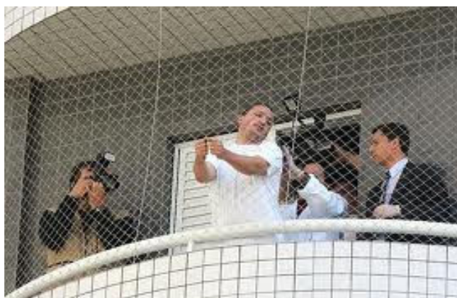
Figura 26: Peritos examinam a tela de proteção

Peritos realizam a reconstituição do crime. O trabalho no Edifício London começa por volta das 9h40min e vai até às 17h15min. Técnicos simulam por duas vezes a queda da menina. Uma boneca com peso e tamanho de Isabella é lançada pelo buraco da tela de proteção, mas não despenca: fica pendurada por cordas. A reportagem do Fantástico tem acesso a fotos de objetos que foram recolhidos do apartamento da família. Entre os objetos encaminhados ao Núcleo de Física do IC está a rede de proteção da janela por onde a menina foi jogada.