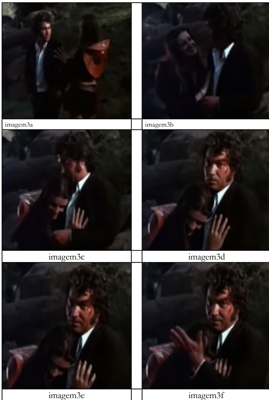
Imagens 3a a 3f: Del encontra Pastor: final feliz