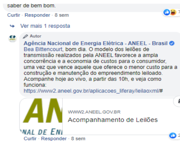
Figura 2 - Nível de Interação Reativa Informante

Por outro lado, em muitos momentos da análise, nos deparamos com características que não se tratavam de respostas diretas, porém, tampouco evidenciavam diálogo. (FIGURA 2).