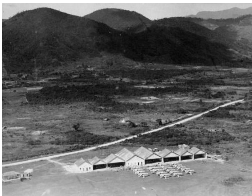
Figura 1: Campo dos Afonsos, em 1919 | Imagem: Reprodução FAB

O Aero Club nasceu no atual aeródromo militar de Campo dos Afonsos, no Rio de Janeiro, onde atualmente se localiza a Base Aérea dos Afonsos e o Museu Aeroespacial (MUSAL), e aonde antigamente funcionava uma fazenda pertencente à família dos Afonsos.