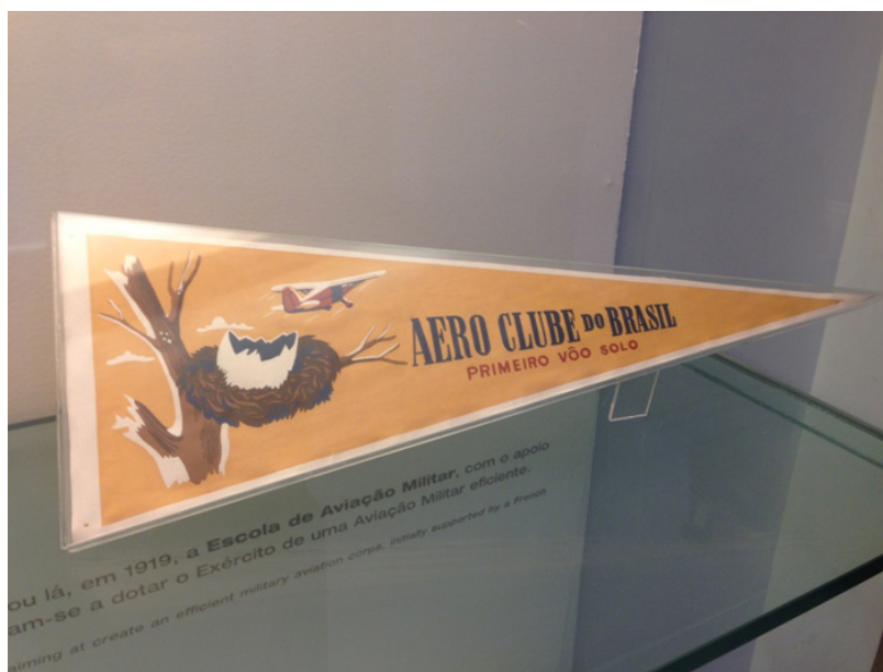
Figura 5: Foto da flâmula comemorativa do 1º voo solo do Aero clube do Brasil

Além da guarda do acervo bibliográfico com cerca de cinco mil títulos especializados, o Museu Aeroespacial desenvolve pesquisas a fim de estimular as atividades referentes à memória e à cultura aeronáutica brasileira.