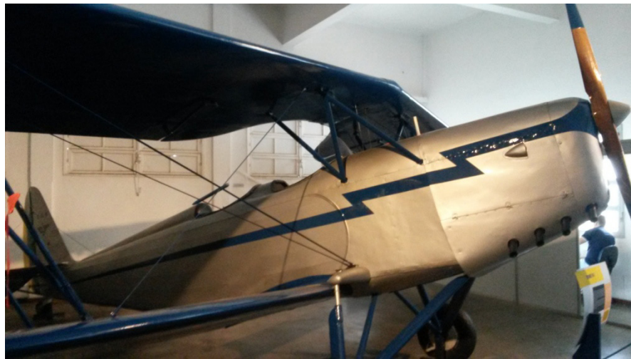
Figura 7: Foto do primeiro modelo fabricado em série no Brasil - Muniz M-7 (1938) –