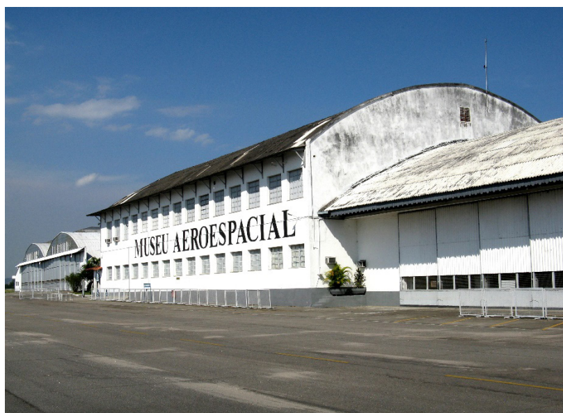
Figura 6: Museu Aeroespacial (MUSAL)

A ideia do museu surgiu em 1943, pelo então Ministro da Aeronáutica Joaquim Pedro Salgado Filho. Contudo, por falta de local disponível, somente pode ser inaugurado em 18 de outubro de 1976, nas instalações que pertenceram à primeira escola de aviação civil localizada no Campo dos Afonsos, no Rio de Janeiro, onde funciona até hoje.