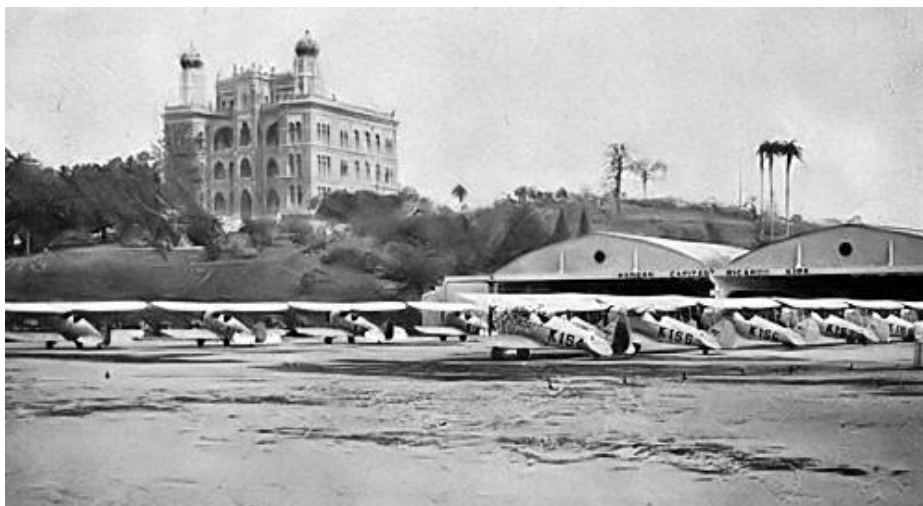
Figura 4: Foto das instalações do Aeroclub do Brasil em Mangueiras

o instituto Oswaldo Cruz permitiu que fosse desbastada uma pequena área em seus terrenos.