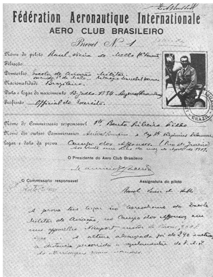
Figura 3: Foto do primeiro brevet expedido pelo "Aero Club Brasileiro"

ao Presidente do Aero Club que o Exército iria precisar das instalações do Campo dos Afonsos para instalar sua própria Escola de Aviação Militar.