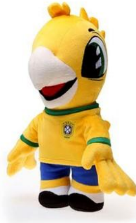
Figura 4 – Boneco Canarinho, oficial da CBF