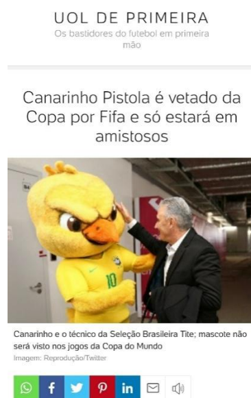
Figura 6 – Início da página da matéria