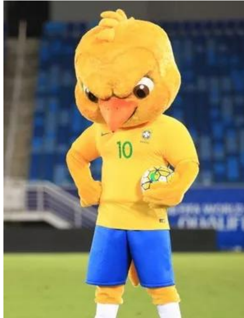
Figura 5 – Canarinho “Pistola”, oficial da CBF