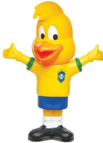
Figura 3 – Boneco Canarinho, da marca Mascote Mania