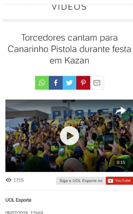
Figura 10 – Página do vídeo