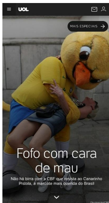
Figura 11 – Capa do Infográfico