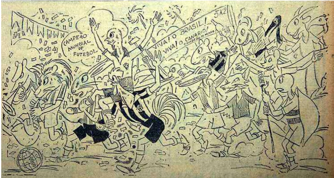
Figura 1 – Charge de Fernando Pierucetti