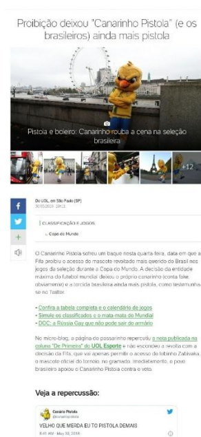
Figura 7 – Página do artigo