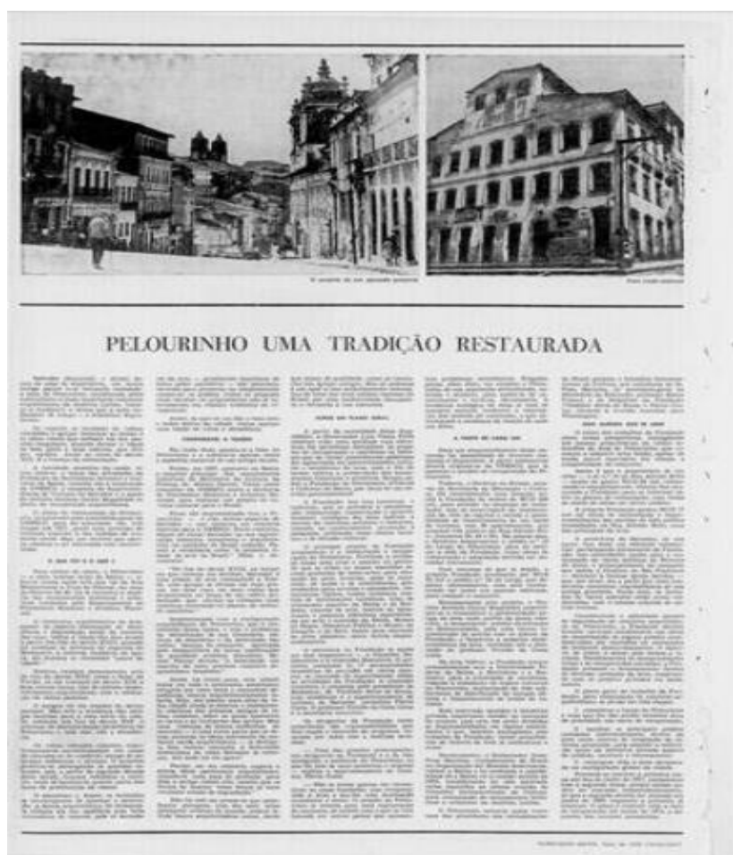
Figura 4: publicação do Jornal do Brasil, 13 de novembro de 1968