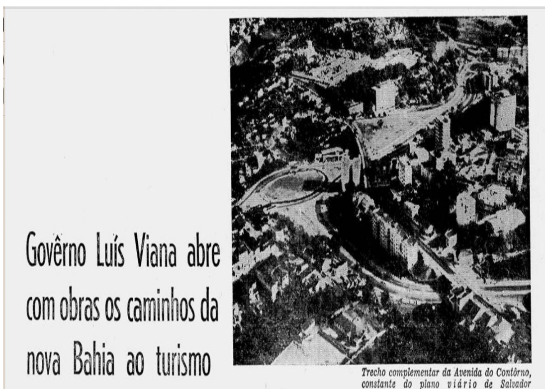
Figura 1: Campanha publicitária do governo Luis Viana Filho

160