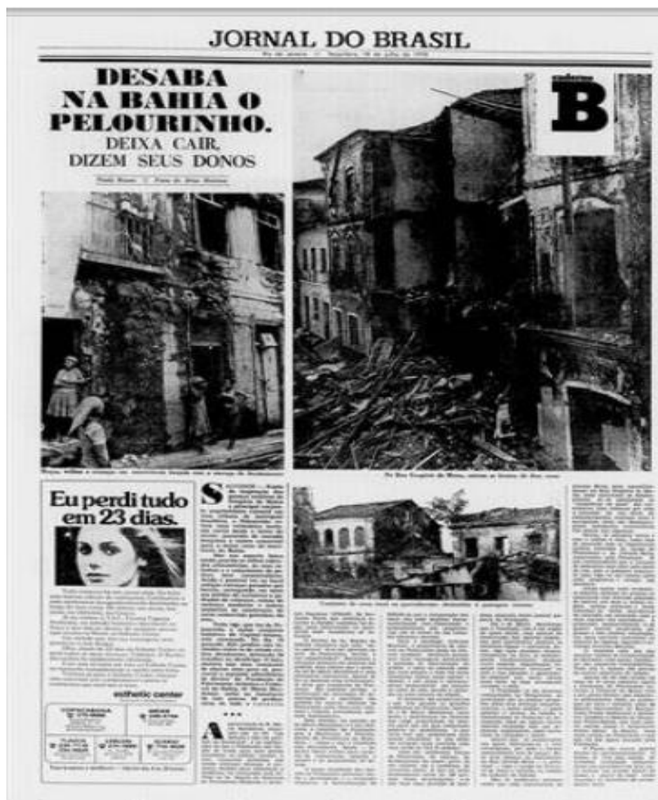
Figura 6: publicação do Jornal do Brasil, 18 de julho de 1978

224