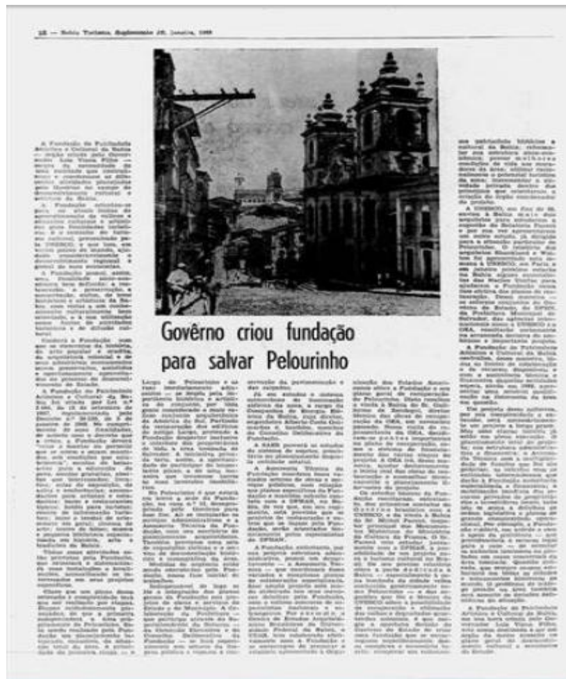
Figura 2: Campanha publicitária do governo de Luis Viana Filho

165