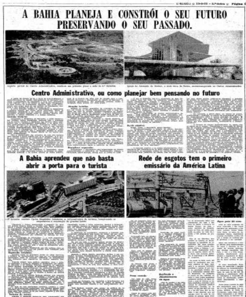
Figura 3: Campanha publicitária do governo Antonio Carlos Magalhães