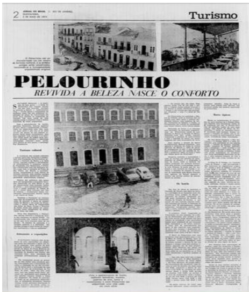
Figura 5: publicação do Jornal do Brasil, 2 de maio de 1974