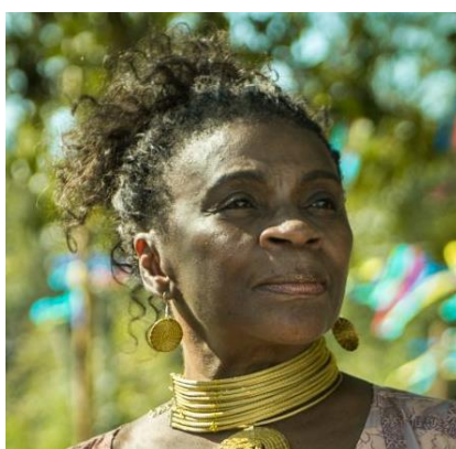
Figura 3 - Zezé Motta

Estava numa festa com a Elke (Maravilha), de classe média alta, sem outros negros além de mim, começaram a perguntar por que eu estava ali, quem me levou? Um clima horrível. Noutra vez, estava na praia com Caetano (acho que era no Farol da Barra), passou um cara gritando “Pra quem será que ela deu pra fazer sucesso”? Eu estava vivendo um momento de exposição. O Caetano foi lá e enfrentou o cara, deu um passa-fora nele, que saiu com o rabo entre as pernas... (MOTTA, 2015).