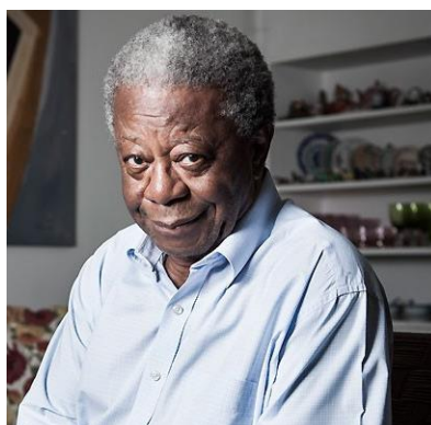
Figura 2 - Milton Gonçalves

Nós brasileiros negros somos 52% da população e a gente ainda não se conscientizou de que somos essa porcentagem da população. O dia que a gente tiver ciência disso, nós vamos mudar esse país (GONCALVES, 2017).