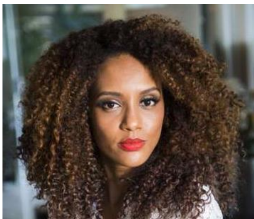
Figura 18 - Taís Araújo