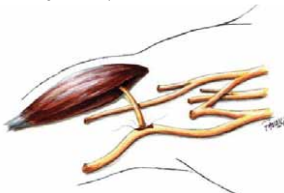
Figura 2A: transferência nervosa terminolateral.