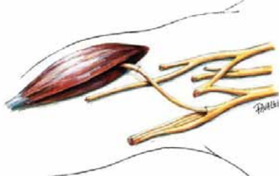
Figura 1B: transferência nervosa terminoterminal.