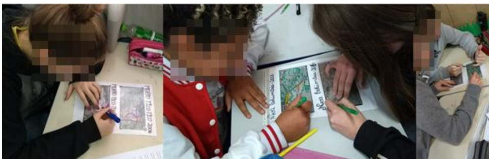
Figura 3 – Estudantes elaborando os mapas

Visando facilitar a análise das imagens, os estudantes criaram seus próprios mapas, utilizando folhas transparentes ( ovewrlay ) de retroprojetor e pincéis marcadores permanentes. A construção do mapa é um procedimento que requer concentração e a precisão, atitudes essas contempladas pelos estudantes, como é observado na Figura 3. Durante a realização dos mapas, os estudantes perceberam a necessidade da elaboração de legendas para melhor compreendê-los, marcando os seguintes elementos: os fragmentos de mata, as estradas visíveis e a área urbana (construções e residências).