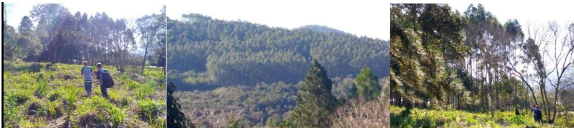
Figura 5 – Saída de campo com a professora de Ciências

Certamente, para responder essas questões seria necessário mais um projeto de pesquisa com os estudantes, mas surpreendidos (professores e estudantes) com tal resultado, organizou-se uma saída de campo (Figura 5) para confirmar a existência de mata exótica na região, prejudicando o crescimento do bioma natural.