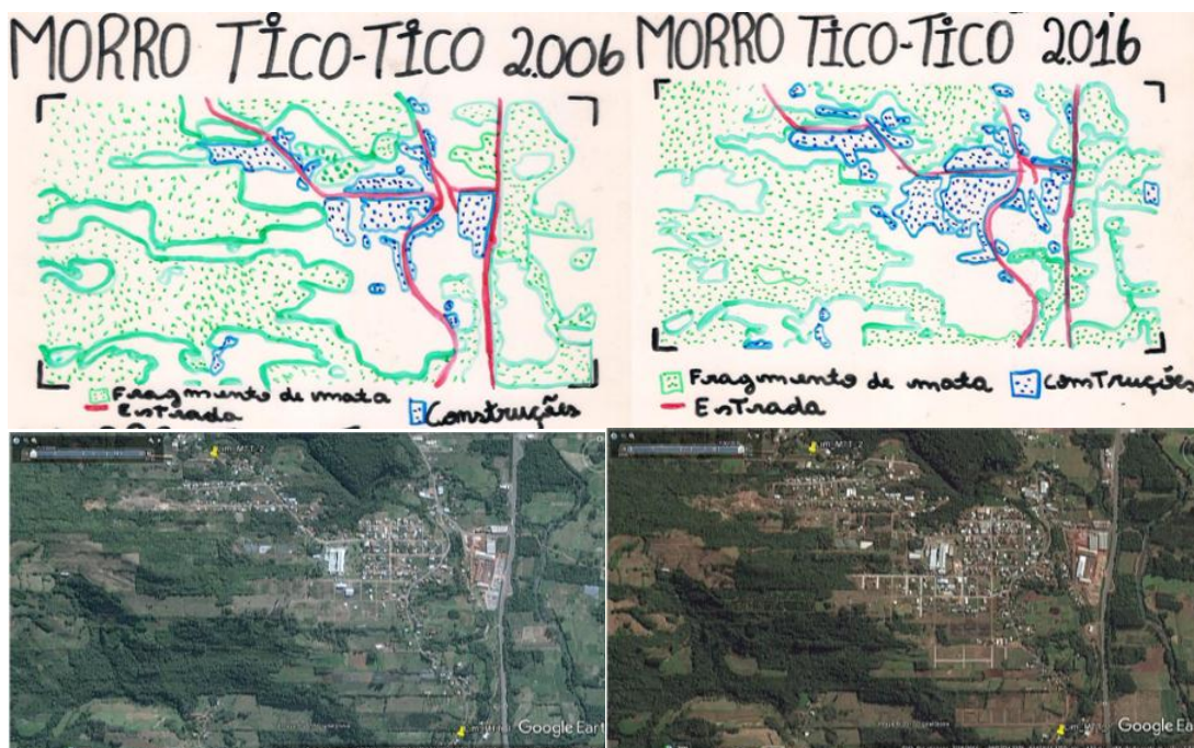
Figura 4 – Um mapa construído pelos estudantes

Por meio dos mapas, tinha-se o objetivo de calcular aproximadamente a área de mata presente em cada comunidade, e comparar os resultados de 2006 e de 2016. Já se previa dificuldades nos cálculos, pois as áreas provavelmente teriam curvas, não seriam representadas por um polígono, como mostra a Figura 4.