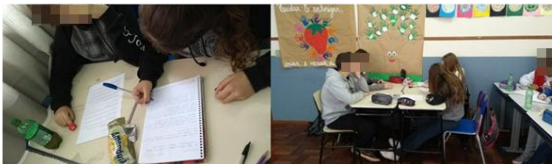
Figura 1 – Estudantes analisando as entrevistas

comunidades de Piedade e Bom Fim Alto não sofreram com o desmatamento, pois as comunidades não cresceram tanto em termos populacionais, segundo os entrevistados.