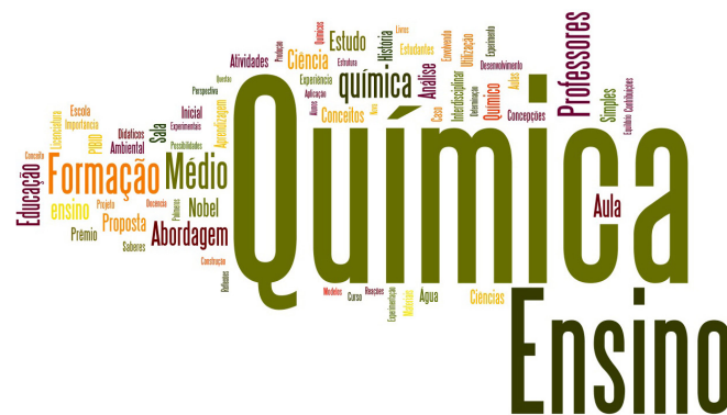
Figura 1: Nuvem de palavras constituída pelos títulos dos artigos da QNEsc – 1995-2014.

De 1995 a 2014, foram publicados na QNEsc 561 artigos, sem considerar resenhas, notas e editoriais. Reunindo todos os títulos desses artigos e selecionando as 70 palavras que estão mais presentes nos títulos, obtém-se a nuvem de palavras (Figura 1).