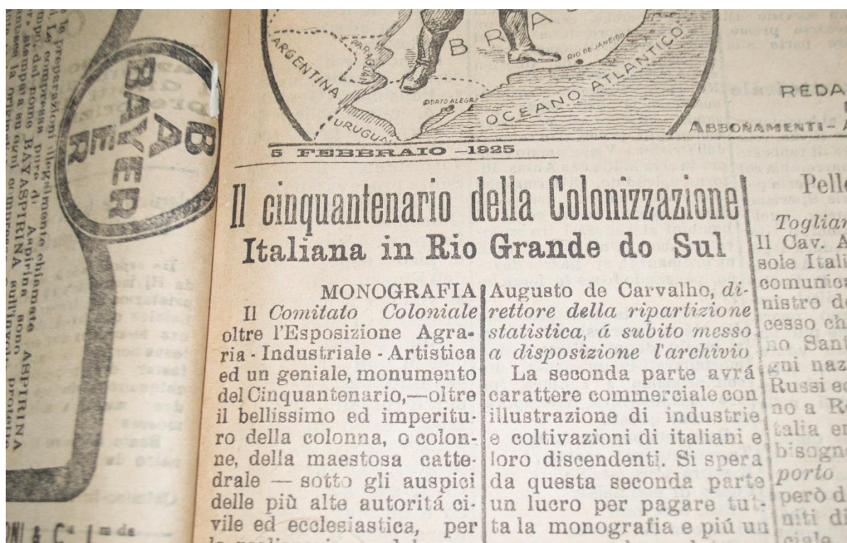
Figura 08 - Publicação sobre o cinquentenário da imigração italiana no Rio Grande do Sul, geralmente noticiadas no quadrante superior esquerdo do referido jornal. Il Corriere d'Italia , 05 de janeiro de 1925.

Aos muitos italianos, seus filhos e descendentes que vivem no Rio Grande, fazemos um apelo para que estes possam contribuir generosamente para o sucesso das celebrações do quinquagésimo aniversário da nossa emigração, para as festividades que culminarão na maior feira agrícola - Industrial - artística de Porto Alegre. É o tempo de trabalho, ativo e intensivo, para a preparação do grande evento e todos nós temos que fazer um compromisso de honra de que faremos tudo que podemos fazer. Nenhum comerciante e nenhum industrial deve deixar de trazer a sua contribuição para a monografia e para a exposição; nenhum italiano, o filho e descendente de italiano, deve negar suas ofertas para as despesas das partes e exposição. Todo o ano o dever de participar da forma mais generosa. Se cada um dos italianos e os seus filhos ou descendentes - no Rio Grande são mais de 250.000 - oferecer, facilmente podemos recolher centenas de contos. (...) 400