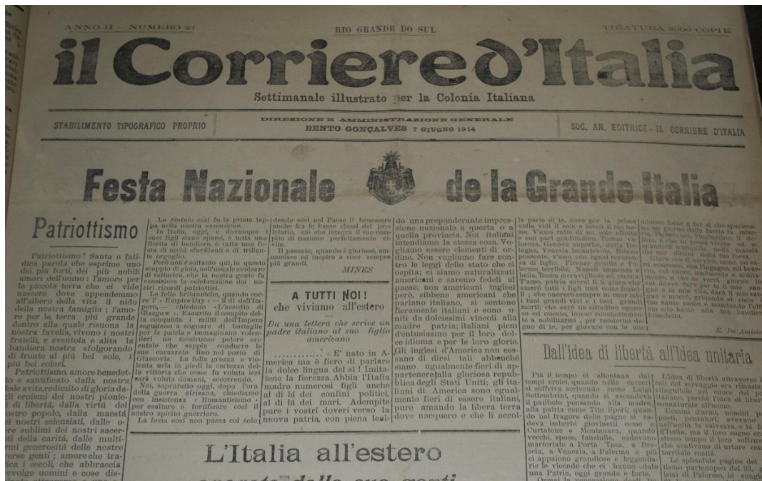
Figura 01 - Il Corriere d'Italia, 07 jun. de 1914. Jornal enfatiza as comemorações promovidas em nome da nação italiana.

Ainda na primeira página, novamente o “estatuto” é mencionado, enfatizando que, sem a existência deste documento, fruto da guerra pela “independência da Itália”, o bem-estar alcançado às populações italianas correria severo risco, sendo necessária a manutenção da carta constitucional para o futuro deste povo, simbolizando um dos elementos fundantes da nação, se não o principal 129 .