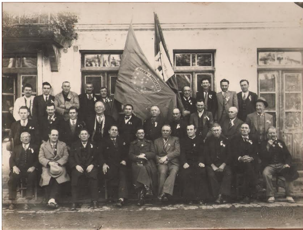
Figura 05 – Fotografia do Fascio Hugo Pepe de Bento Gonçalves em 1930.