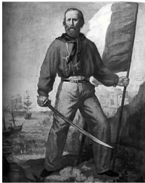
Figura 03 – Pintura de G. Induno. “Giuseppe Garibaldi”, Itália, 1870.