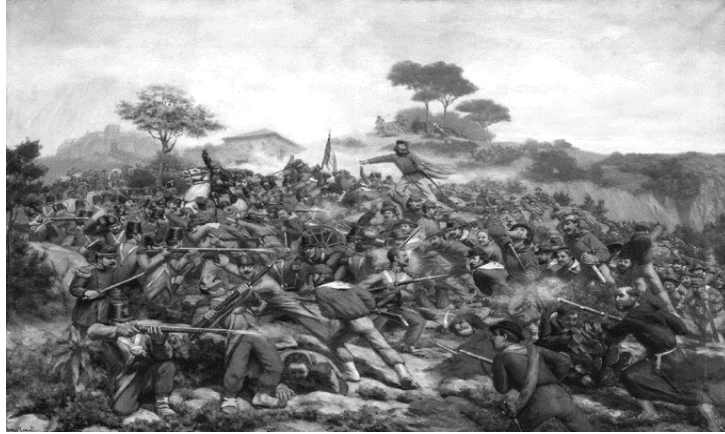
Figura 02 – Pintura de R. Legat, “Balalha de Calatafimi”, Itália, 1860

com o intento de reforçar os laços identitários entre os imigrantes e seus descendentes da nação originária, simbolizada por este líder da unificação.