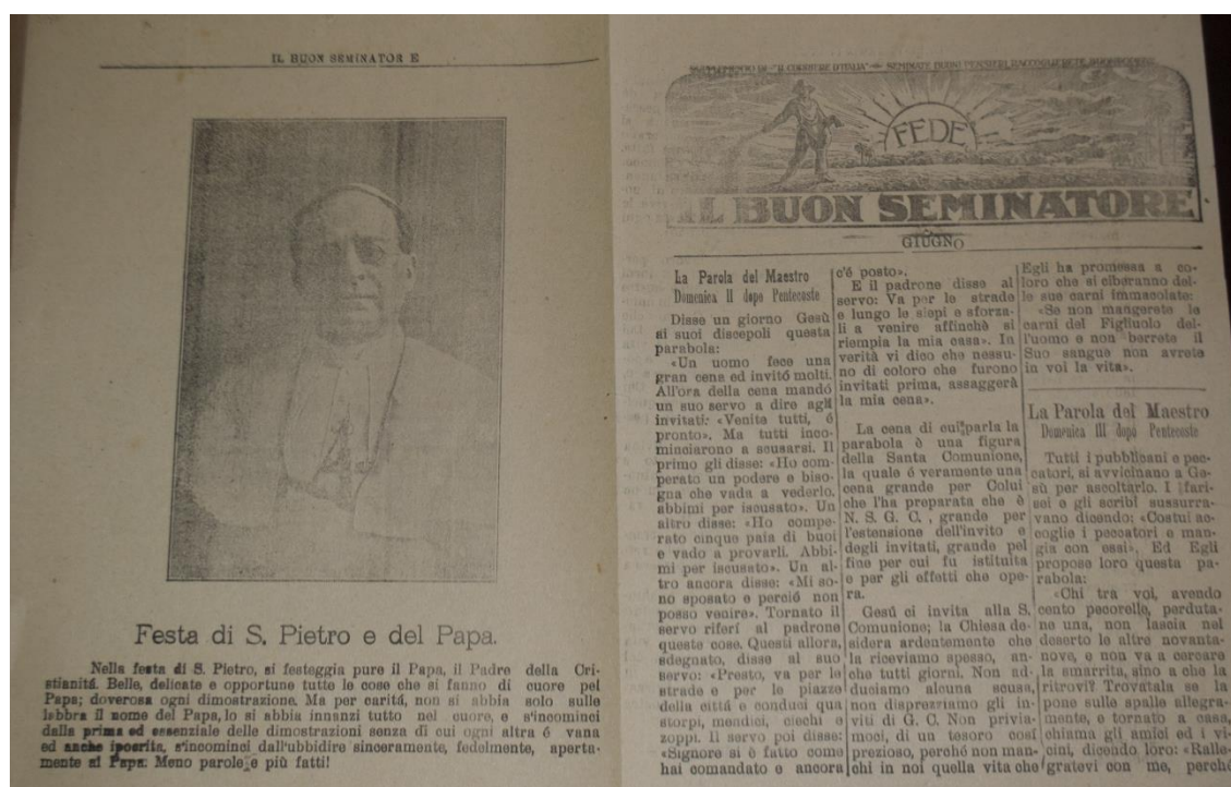
Figura 09 – Livreto que entrou em circulação em janeiro de 1925, de autoria scalabriniana e disponibilizado em conjunto com unidades do Il Corriere d'Italia .

assuntos, permitindo que o editorial tivesse mais espaço para desenvolver matérias de natureza espiritual e, deste modo, ampliar ainda mais a vocação evangelística da Ordem carlista.