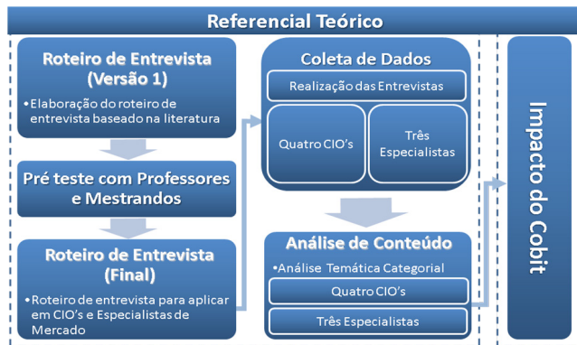
Figura 2 – Desenho de pesquisa

Inicialmente foi desenvolvida uma versão inicial do instrumento com base na literatura. O roteiro de entrevistas consistia em 15 perguntas abertas, de caráter genérico, com intuito de deixar os participantes expressarem livremente suas percepções sobre o assunto. O instrumento