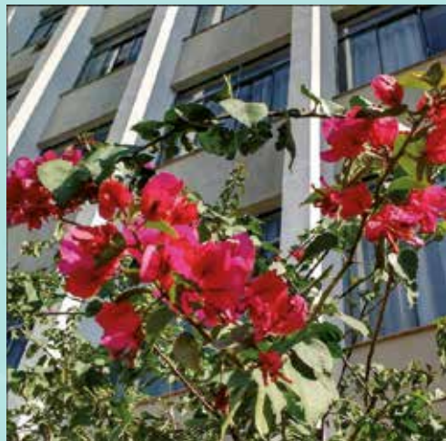
As cores são tão vivas que dispensam filtros