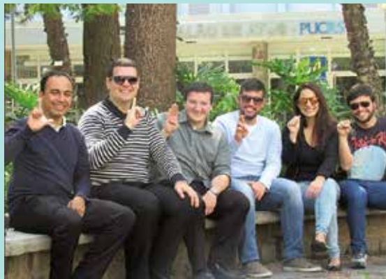
Melhor cadeira! #libras