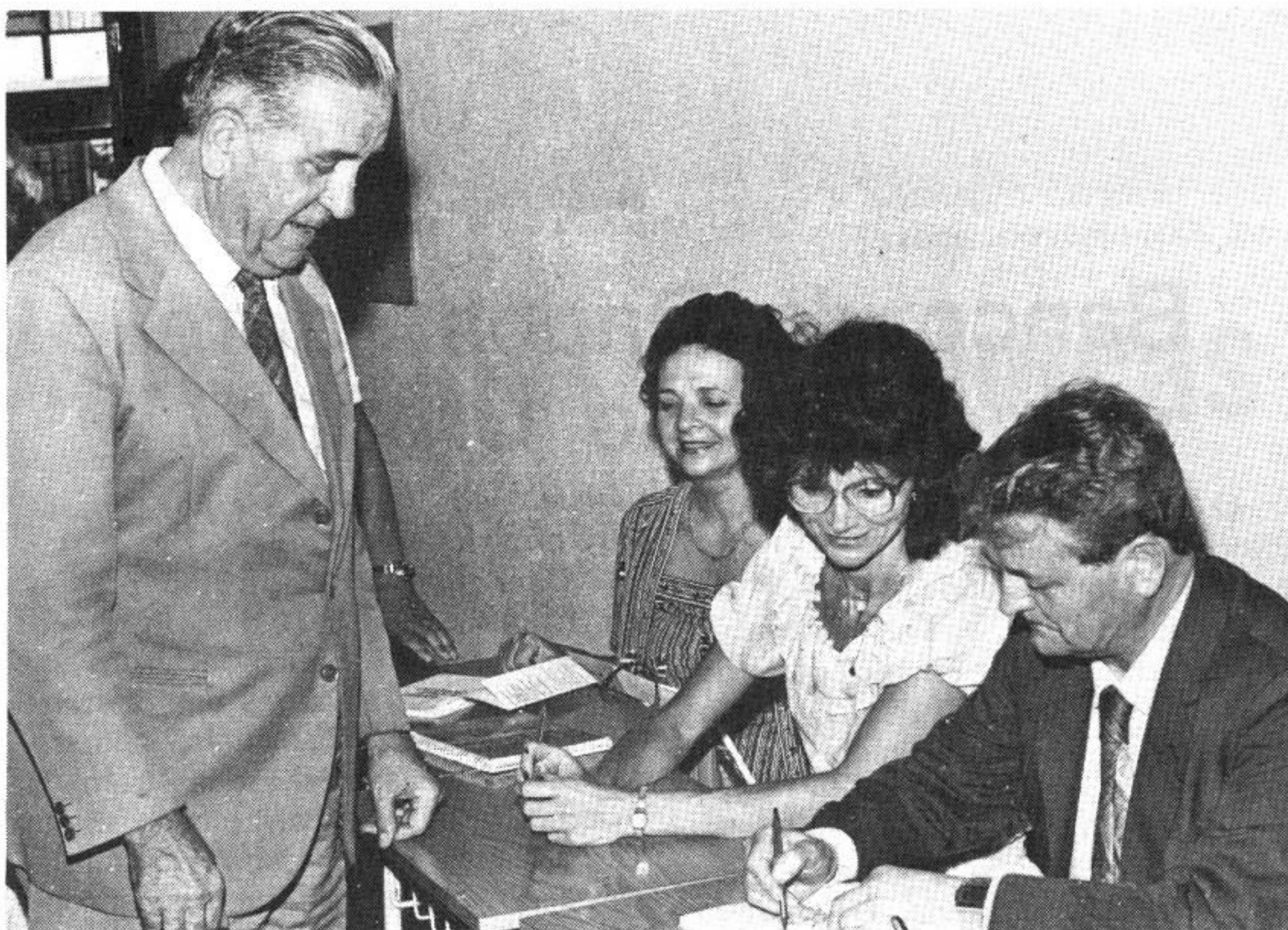
Vice-reitor prestigiou o lançamento do livro.