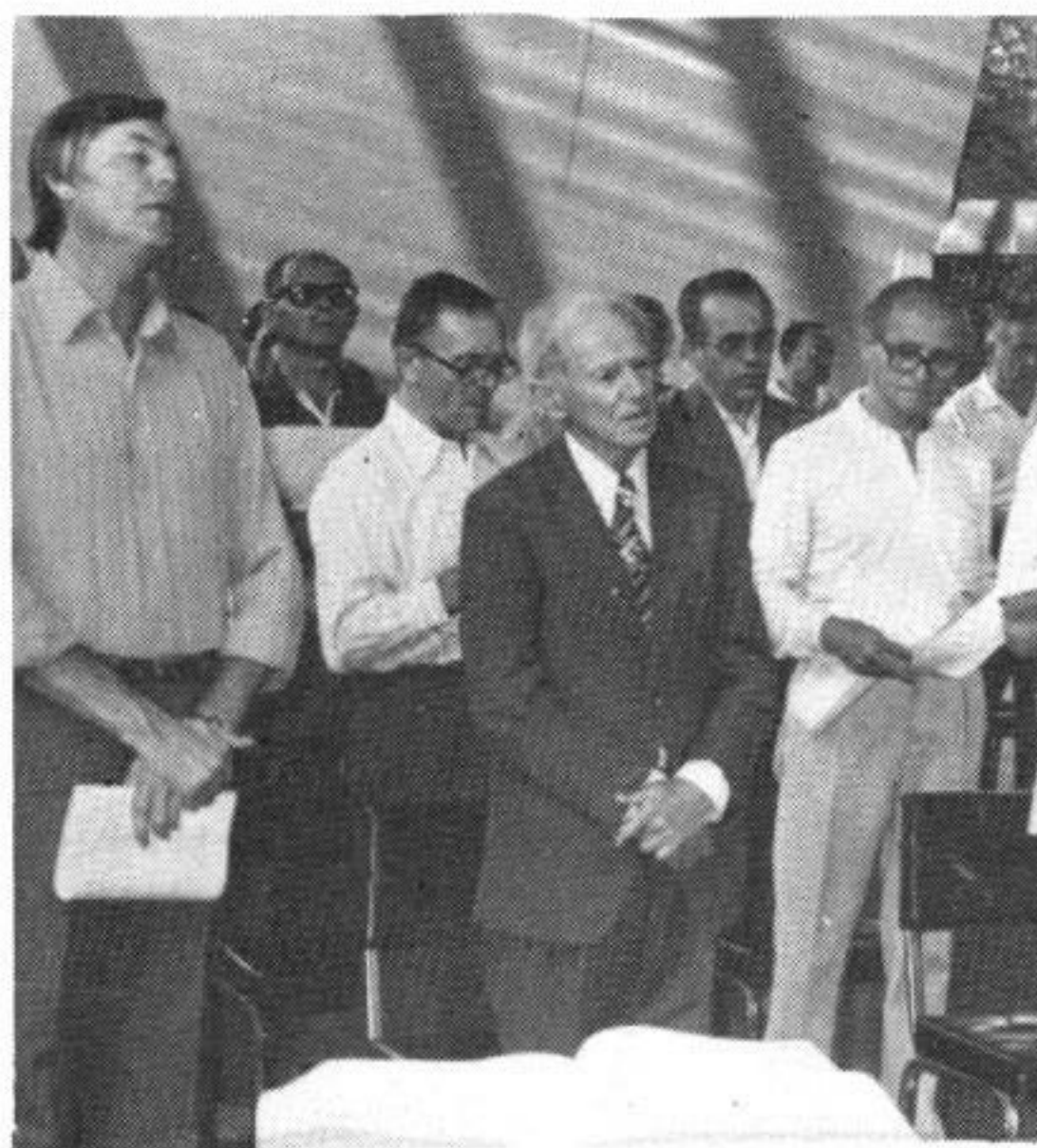
Missa festiva ao ex-vice-reitor.

Para comemorar a data foi rezada uma Missa festiva, com a presença de autoridades da Província Marista e da Universidade, bem como de seus