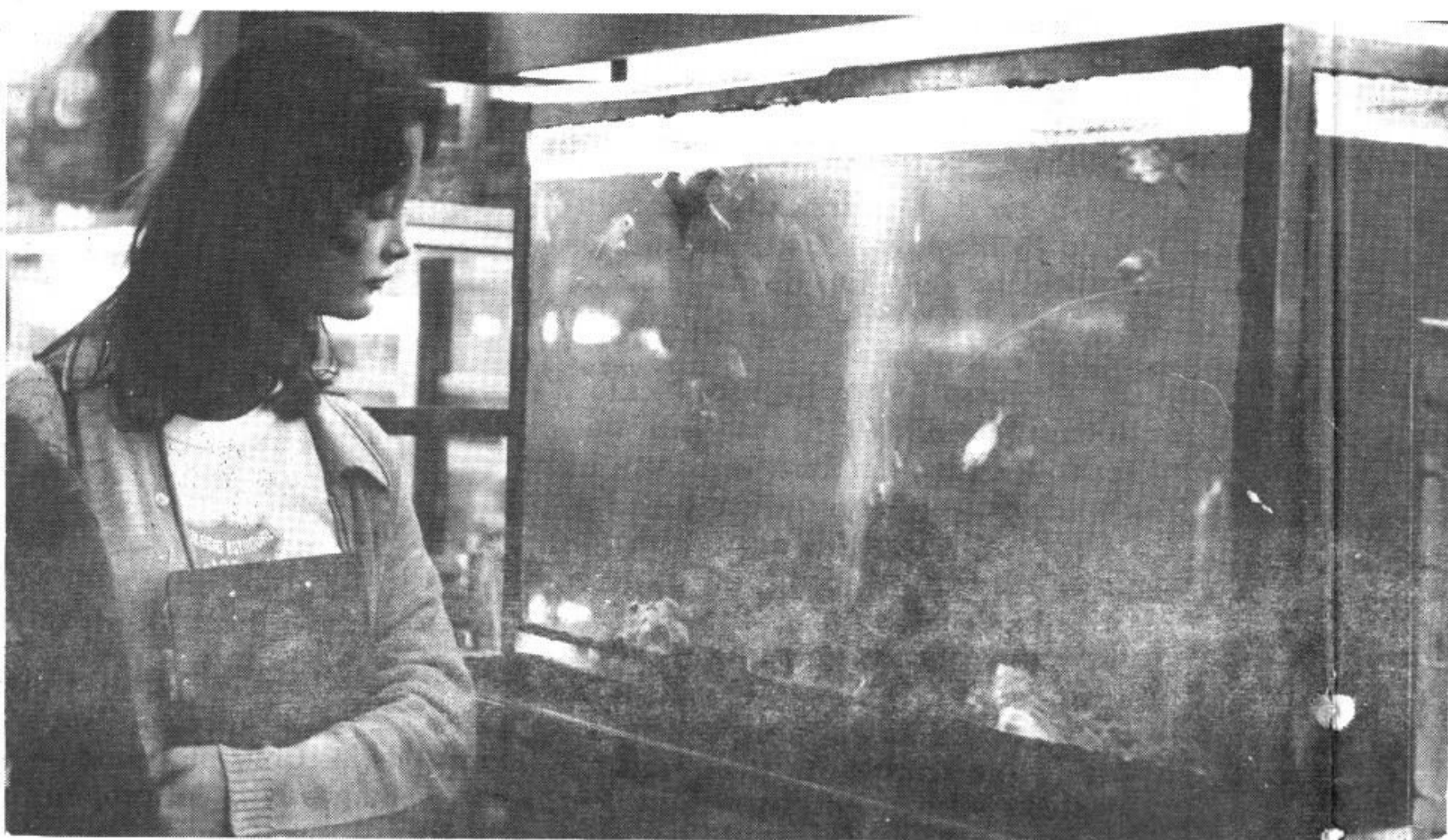
Está aberto a estudantes e público em geral.

Dividido em três áreas, um dos setores do Museu é de Ciências do Homem, apresentando peças de cultura indígena brasileira, africana e inca, vestimentas e cabeças mumificadas, coleção numismática e arqueológica.