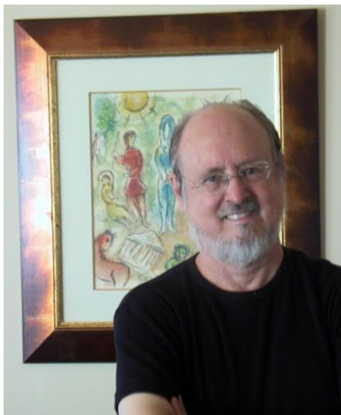
Figura 1 – Douglas Kellner, em 2001

Herdeiro da tradição crítica nos Estados Unidos e interessado pelos estudos de mídia, Douglas Kellner iniciou sua trajetória acadêmica em 1964, ao receber uma bolsa de estudos na Universidade de Copenhague. Retornou aos Estados Unidos, onde concluiu sua graduação em filosofia, e ingressou na The New School, instituição de viés progressista em Nova York, que ficou conhecida por receber intelectuais exilados durante o nazismo.