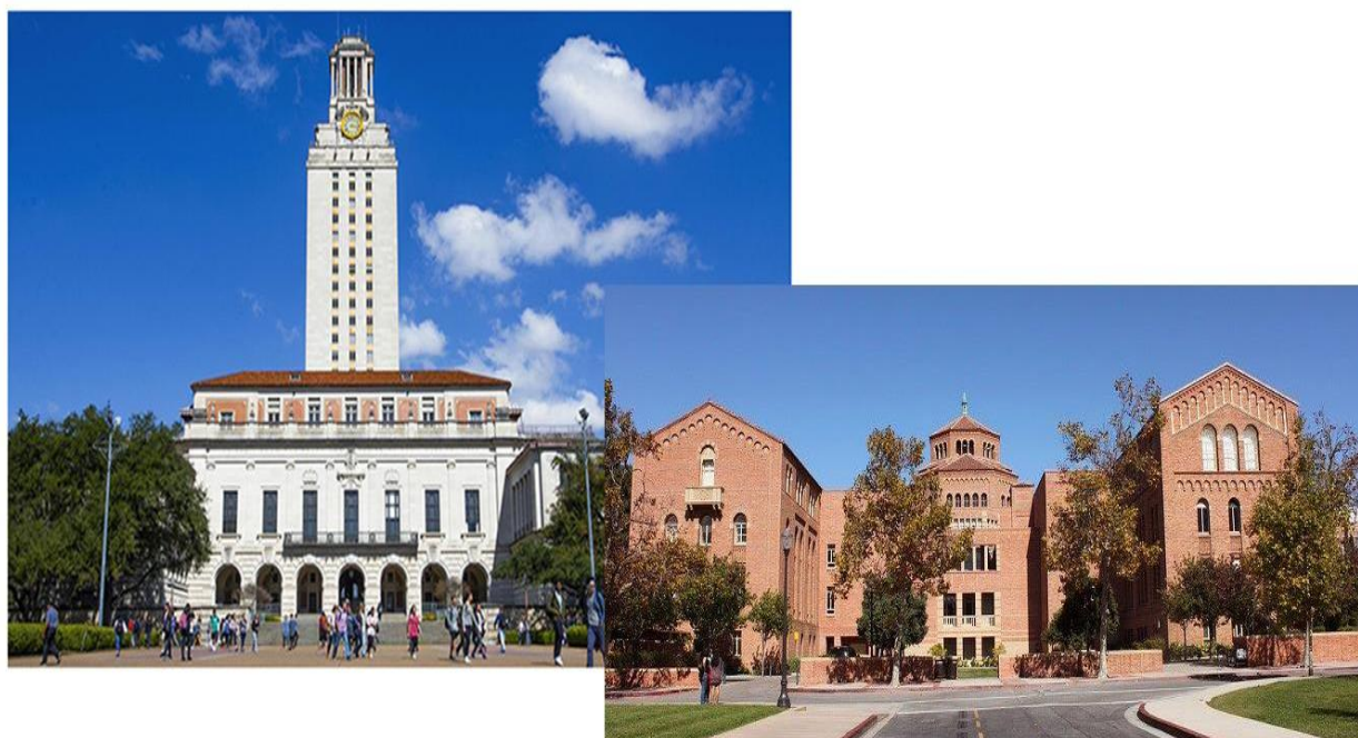
Figura 2 – Universidade do Texas, em Austin; Universidade da Califórnia, em Los Angeles