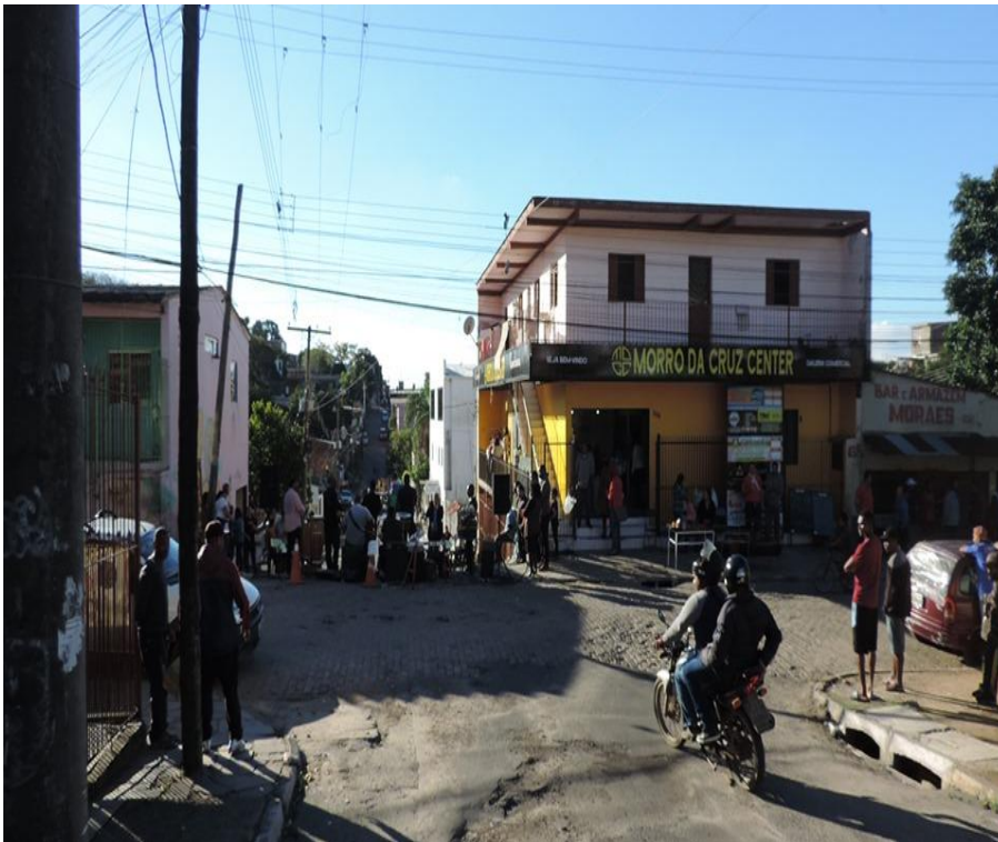
Imagem do acervo pessoal do autor, 2018