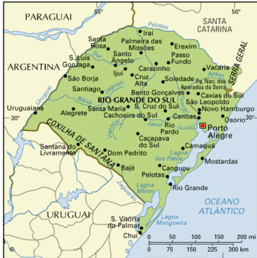
Figura 3- Mapa do Rio Grande do Sul

Para sintetizar este segundo nível do espaço de fluxos e sua correlação com o espaço de lugar utilizaremos as próprias palavras de Castells. Ele diz que,